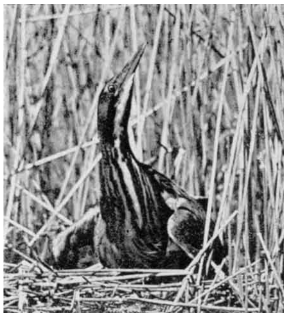
Rørdrummen sniger sig ind til sin Rede i en Rørtkning. Holdningen er karakteristisk, med det højt løftede Næb; Halsens Længdestriber falder derved sammen med Omgivelserne. Tømmerby Fjord.

en uforglemmelig Oplevelse hovedsagelig for Rørdrummens Skyld. Man kan faa det Indtryk, at Fuglen er ret talrig. Fra alle Sider kommer de stærke, dybe Lurtoner og glider sammen til en mægtig bølgende Tone næsten uden Ophold og af en betagende Virkning i de stille Skumringstimer, hvor alle andre Fugle sænker Stemmerne. Intet Menneske i Vejlerne Omegn har kunnet undgaa at høre disse mærkelige Lyde, men faa er klar over, hvor de stammer fra, og endnu færre kender Fuglen, skønt den i Ungetiden Maj og Juni er et næsten dagligt Syn i Luften over visse Dele af Vejlerne, hvor den har sine Ruter mellem Rede og Fiskepladser. Folk, som har haft Rørdrummens Brøl ind ad Vinduerne hver Sommernat det meste af deres Liv, stiller sig vantro, naar man fortæller dem at Ophavet er en Fugl. Naturligvis kender de Lyden, men har vænnet sig til at overhøre den, som man overhører Lærkesangen eller Havets Brusen bag Klitterne. Ornitologer beskriver Lyden som fjerne Kobrøl eller Løvebrøl, Pust i en tom Flaske, et Dampskibs Fløjte, en Lydbøje paa Havet, - altsammen gode Sammenligninger paa Afstand, men ikke paa nært Hold. Da maa man give Digteren Ret, naar han taler om Rørdrummens "Pauke". Brølets dybe, rene Metalklang er dets mest karakteristiske Egenskab og en forbløffende Lyd at høre fra en Fugls Strube.