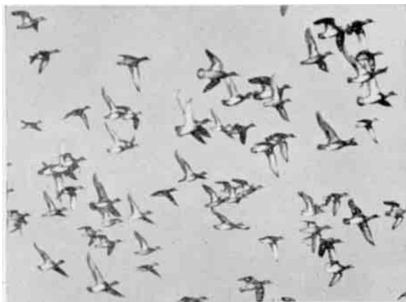
Lettende Andeflokkede – Krikænder og Pibeænder – i Træktiden om Efteraaret.

Det er en Skæbnens Ironi, at disse storartede Fuglesumpe er fremkommet som Følge af en af de største Tørlægningsplaner her i Landet. For 80 Aar siden gik to store Arme fra Limfjorden nordpaa i Landtangen mellem Thy og Vendsyssel, adskilt af den høje bakkede Halvø Hannæs. Deres lave Vand og delvis mudrede Bund fristede til Udtørringsforsøg. Der kunde gro saa og saa mange Læs Korn og bjerges saa og saa meget Hø. Et umaadeligt Arbejde og mange Mill. Kr. blev lagt i Tørlægningen, som ikke desto mindre endte med at slaa fejl. Den første Dæmning byggedes paa fire Aar. Stormfloder brød igennem, der maatte begyndes paany. Et Net af Kanaler blev spændt ud over Fjordbunden for at lede Vandet til Sluserne, men hverken Vindmotorerne eller de store Maskinpumper kunde tumle Vandmasserne, naar det hele blev til Søer om Vinteren og Foraaret. Græsset maatte plantes Tot for Tot med Hænderne for at modstaa Strøm og Oversvømmelse. Korn kom der ikke til at vokse i Vejlerne.