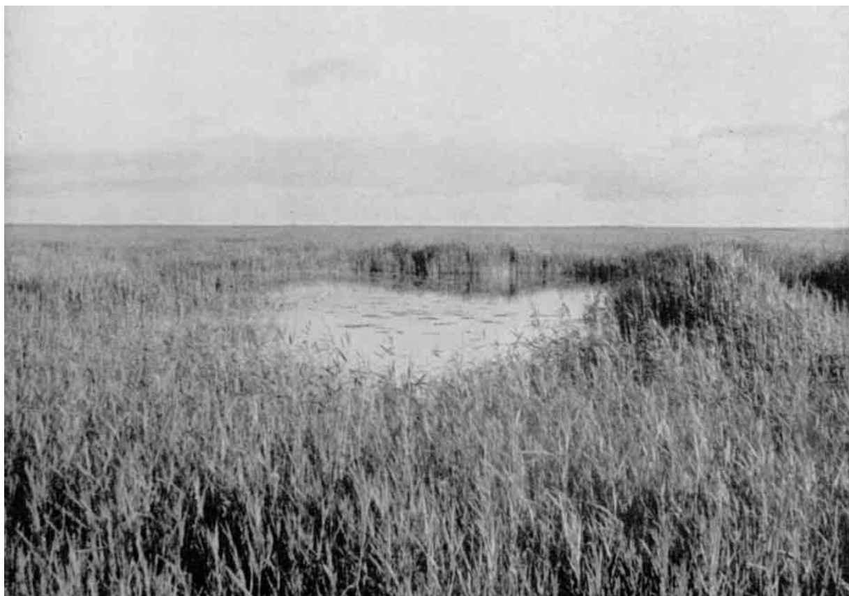
Rørskovene i Glombak, set mod Syd fra Krapdæmningen. Her yngler Taffelænder, Troldænder, Graaænder, Lappedykkere, Rikser, Rørhøg, Graagaas o.m.a.