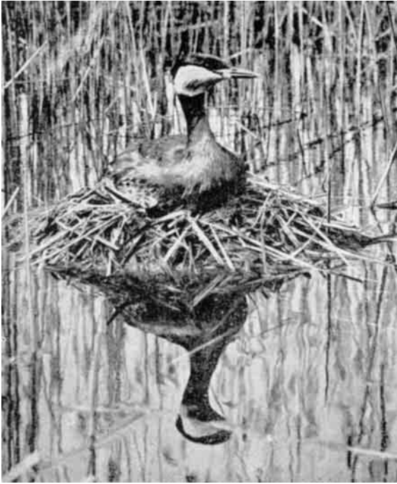
Rødhalsed Lappedykker paa sin svømmende Rede ved Kærup Holme. Vandet er ca. 1 Meter dybt.

Forsommer tvinger Fuglene til at yngle sent; endnu i August kan der være Æg paa Rederne, og følgelig Unger langt hen i September. Eller er det Jagttidens aarligt tilbagevendende Sejlads og Skyderi paa Søen, i Forbindelse med ivrige Ornitologers Besøg, der efterhaanden bliver dem for meget? Deres Æg er en Lækkerbidsken for kyniske Ægsamlere. Og Skehejren er ikke i Stand til at skjule sig som Rørdrummen, har heller ingen Sans for det, staar oprejst paa Reden i timevis. En saadan Fugl synes dømt til at uddø. Dens hvide Dragt lyser i Kilometers Afstand. Vegetationen paa dens Rugeplads er ikke engang særlig høj eller tæt, selvom svære og meget brede Rørskove spærrer godt af mod Landsiden. Der er ingen Tvivl om, at Stedet er valgt med Omhu. Hvis man ikke netop havde de hvide Halse over Rørskoven til Vejledning, vilde det praktisk talt være umuligt at finde Vej i den grønne Ensformighed, hvor Rørholmene uden Forskel glider over i hinanden. Først paa nogle Hundrede Meters Afstand gaar Fuglene paa Vingerne og forsvinder, dog for at