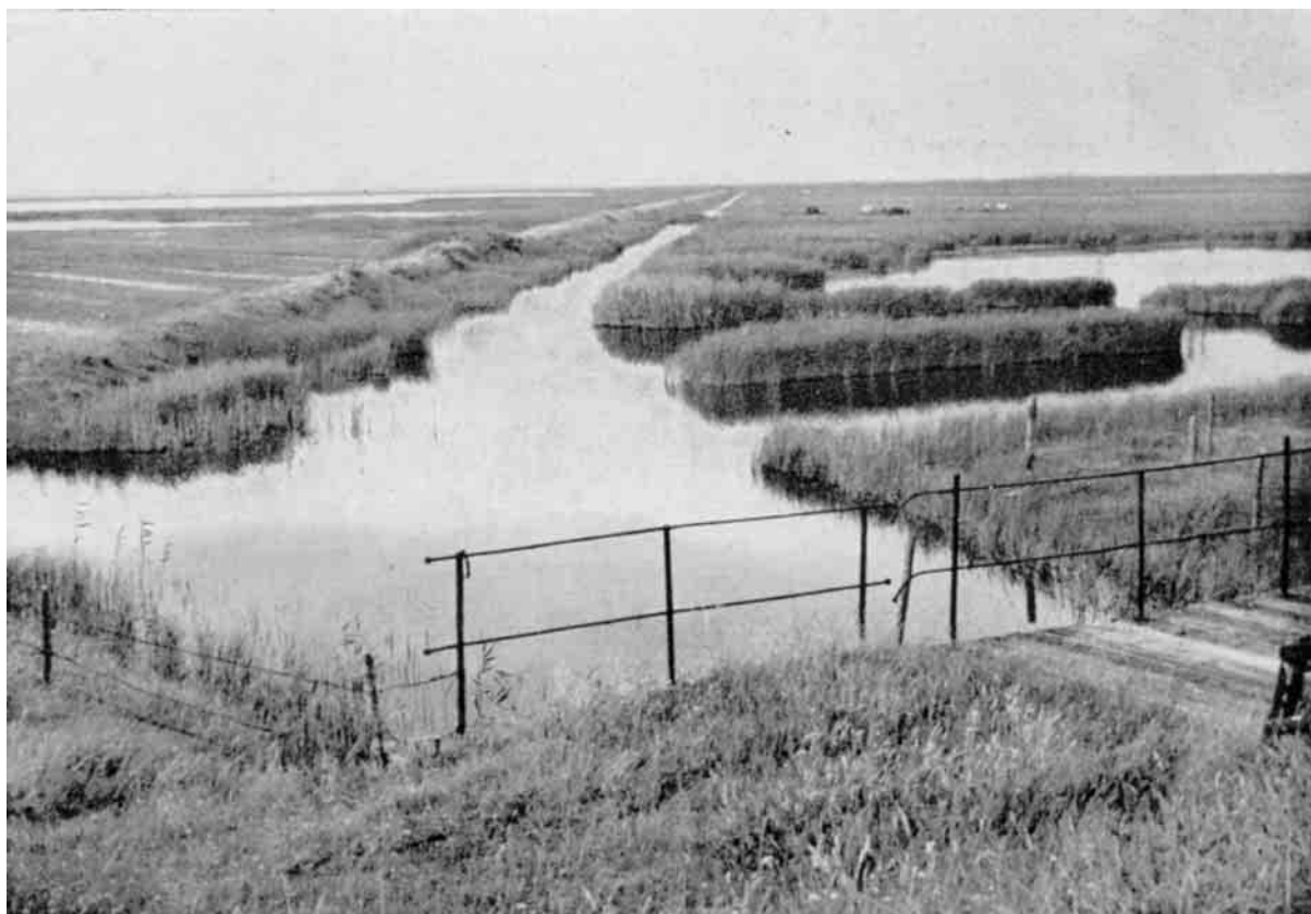
Bveholms Veile set fra Syd: Vældige Eneflader, eennemskaaret af Kanaler.