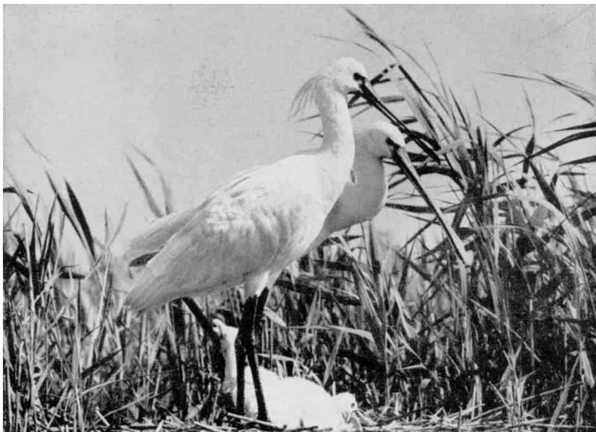
Skehejreparret hos Ungerne i Højsommerens mørkegrønne Rørskov.

Taffelænder, i større og tættere Flokke jo nærmere vi kommer Skehejrens Tilholdssted, og jo sværere det bliver at stage Baaden frem gennem det dybe Mudder. Men det er tydeligt, at de føler sig sikre herude, for de flyver ikke langt inden de kaster sig igen. Heller ikke Skehejrerne er særlig sky, skønt ufravendt opmærksomme. Ubevægeligt staar de nu alle oprejst paa Rederne med de spejdende Halse strakt frem over den grønne, bølgende Rørskov faa Hundrede Meter borte, omgivet af spredte Hættemaagekolonier. Der bliver stadig mindre Vand over Mudderet. Baaden hænger uhjælpelig fast, der er ikke andet at gøre end forlade den og fortsætte i knædybt, sugende Mosedynd. Først da gaar de store hvide Fugle paa Vingerne, hele ti paa én Gang, stiger i et Par brede Cirkler over Kolonien, mens de ordner sig i smuk Halvkileform tæt sammen, og forsvinder hurtigt i den blege Soldis over Søen. Grundigt tilsølet, men ikke uden Højtid og en vis Lykkefølelse staar man ved Skehejrens Rede. Af Form og Opbygning ser den ud som en Blishønerede, kun er den betydelig højere og sværere. 3 smaa dunede Unger skubber sig klynkende mellem hverandre; men tager man dem op, hugger de tappert fra sig med deres gule bløde Næb, der allerede har begyndende Skeform. I Vandet gynger en halv Æggeskal. Andre Reder findes 30, 50 og 100 Meter borte, en med to Æg, en med to halvvoksne, oprejste, arrigt huggende Unger, en Rede endnu tom.