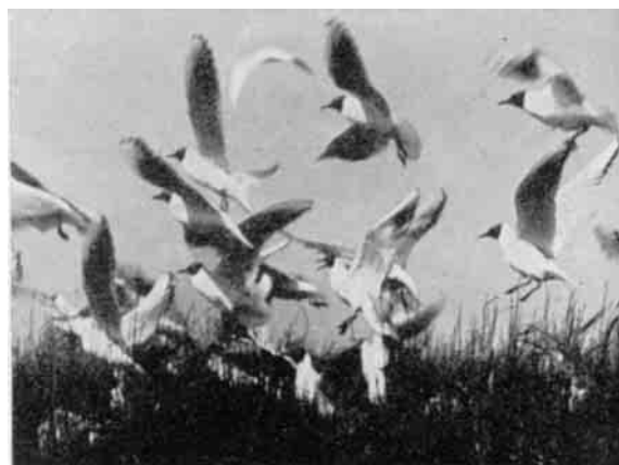
De tætteste Hattemaagekolonier findes i Storbevoksninger langs Kanalerne og paa Mudderbankerne i Søerne. Her er Skrig og Skraal hele Forsommeren.

Udbyttet af et kortere Besøg i Vejlerne, en enkelt Dag, kan naturligvis variere ikke saa lidt efter, hvor man begynder, og hvilken Del af Sommeren man vælger. Under heldige Vejrforhold i Maj eller Juni kan en Vandring paa en af de milelange Dæmninger være som en Vandring gennem hele den danske Vade- og Svømmefugle verden. Øst for Hannæs ligger nærmest Limfjorden Bygholms Vejle med Søen Glombak, derefter Selbjerg Vejle, Hanvejle og nordligst Lund Fjord. Vest for Hannæs i samme Rækkefølge Østerild Fjord, Arup Vejle, Vesløs Vejle og Tømmerby Fjord. Det er jo saadan, at de forskellige Fuglearter i Overensstemmelse med deres særlige Levevis har Forkærlighed for