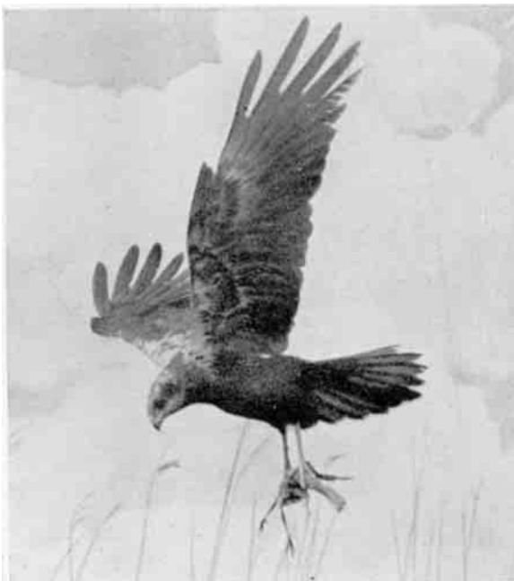
Rørhøgehunnen vender hjem fra Jagt med et Bytte i Fangerne, svævende lavt hen over Rørskoven.

Terner, en Flok Spover paa Vej mod Syd. De ældste piller i deres frembrydende Fjerdragt og søger ind i Skyggen, den yngste klatrer ned til Vandkanten for at kigge nøjere paa et afnavet Blishøneben, som de store Søsken har kasseret. Den er ikke i Stand til at partere det, men svælger det helt og holdent. Saa lægger den sig i Vandet og lader Solen bage sig. Det er ellers sjældent at se Rovfugle bade, men Rørhøgens Unger gør det gerne.