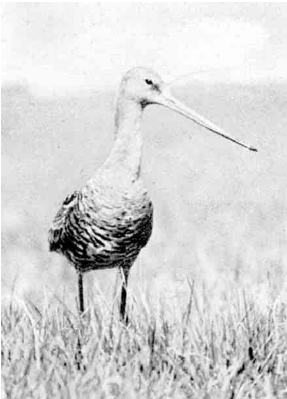
Den store Kobbersnepe strækker Hals og spejder over Vidderne paa Bygholms Vejle.

der kommer dens Æg for nær, bliver hidsigt forfulgt og jaget bort; ikke engang Rørhøgen er den bange for at gaa løs paa. Adskillige Engfugle som Ryler og Brushøns benytter sig af Kobbersneppens Aktivitet overfor Ægrøvere til at anlægge deres Rede i dens umiddelbare Nærhed.