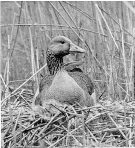
Rugende Graagaas i Rørskovene i Selbjerg Vejle.

Den klogeste og derfor utilnærmeligste af alle Vejlernes Fugle er utvivlsomt Graagaasen, og her er da for en Gangs Skyld Plads til, at den kan følge sin mistænksomme Natur. Vejlerne er paa Vej til at blive et storstilet Ynglereservat for de stærkt udtyndede danske Graagaasestammer. Dens Ynglen i Vejlerne er næppe tyve Aar gammel, men siden har der været en stadig og glædelig Fremgang at spore baade i Antallet af rugende Par og i oversomrende Flokke. Skyheden er maaske særlig iøjnefaldende hos disse yngre, ikke yngledygtige Gæs. I et Antal af flere Hundrede, voksende fra Aar til Aar, lever de et fuldstændigt ubundet Liv og færdes kun, hvor der er fredeligst, og hvor Græsset smager bedst. Man kan være sikker paa, at de har Øjnene med sig og ikke lader sig overliste; i en græssende Flok staar altid en eller flere med spejdende opstrakt Hals. Forsigtigt overnatter de i Rørskovene, trækker herfra tidligt om Morgenen ind paa Engene og tilbage i Skumringen.