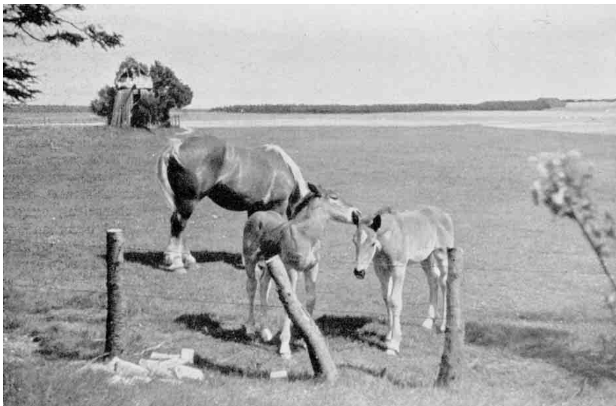
Sommeridyl ved Knudsbjerg. En smuk, rød Hoppe græsser med to dejlige Tvillingføl.

2. Brødjorden - den øvrige Del af Indmarken. Den blev efter Gødskningen almindeligvis dyrket med Korn 5 Aar og laa derefter ubenyttet hen i 5 Aar, til der var dannet ny Grønsvær. Paa Thisted Mark havde man dog følgende Sædskiye: 1. Byg, 2. Rug, 3. Hvid Havre, 4. Ærter, 5. Byg, 6. Sort Havre med Kløver, hvorefter Jorden hvilede i 6 Aar. I Kaastrup Sogn brugtes en 11 Marks Drift med 3 Aars Græs.