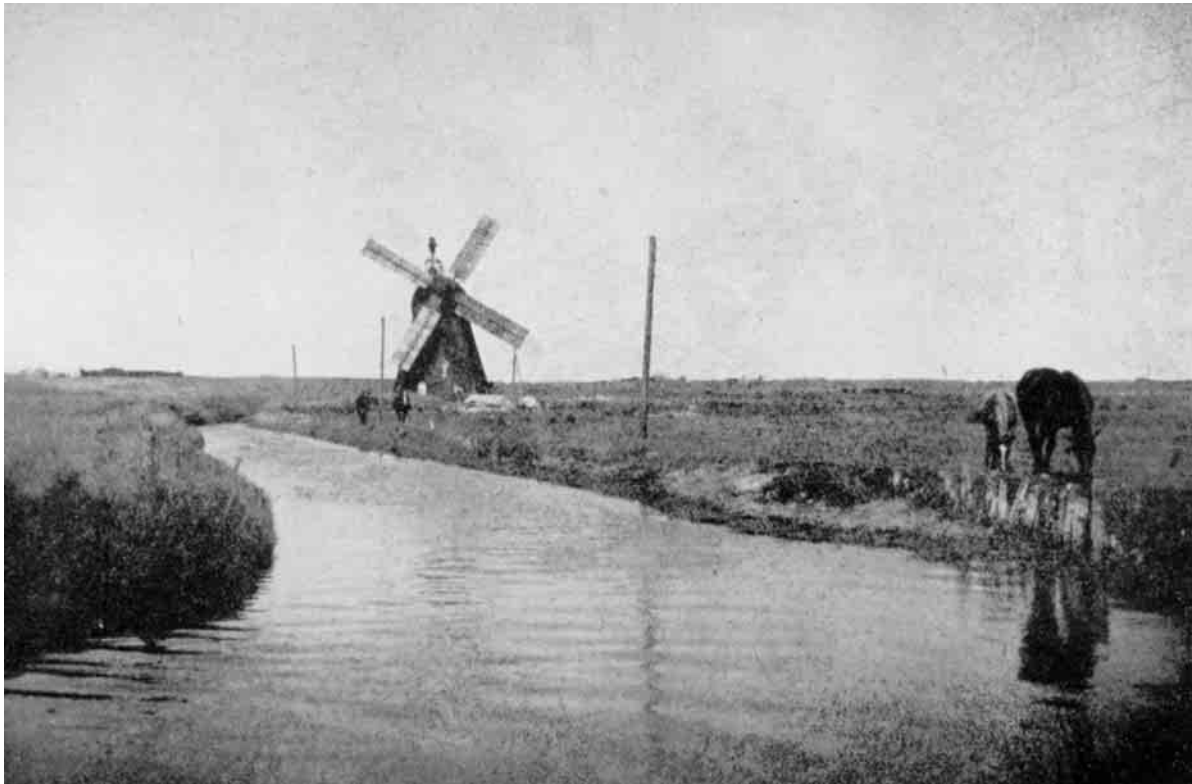
Landskabet ved Færgeborg i Sjørring med den gamle Mølle og den brede Kanal minder ikke saa lidt om Holland.

Spisekartofler som King Edward og Bintje ikke dyrkes i ret stor Stil. Af Foderkartofler er det Alpha, der er mest udbredt.