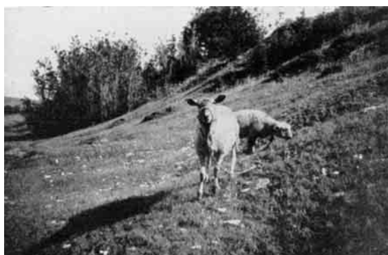
Faareholdet har ikke nogen særlig stor Udbredelse paa Egnen. Her græsser to skikkelige Faar paa de skønne Skrænter ved Hou.

Hassing Herreds Hesteavlsforening, hvor navnlig "Rex", Reg. 1247, Afkomspræmie 2. Kl; 1. Gr., og "Knægten", E. Stb. 1913, har haft stor Betydning, navnlig "Knægten", født 1931 hos P.