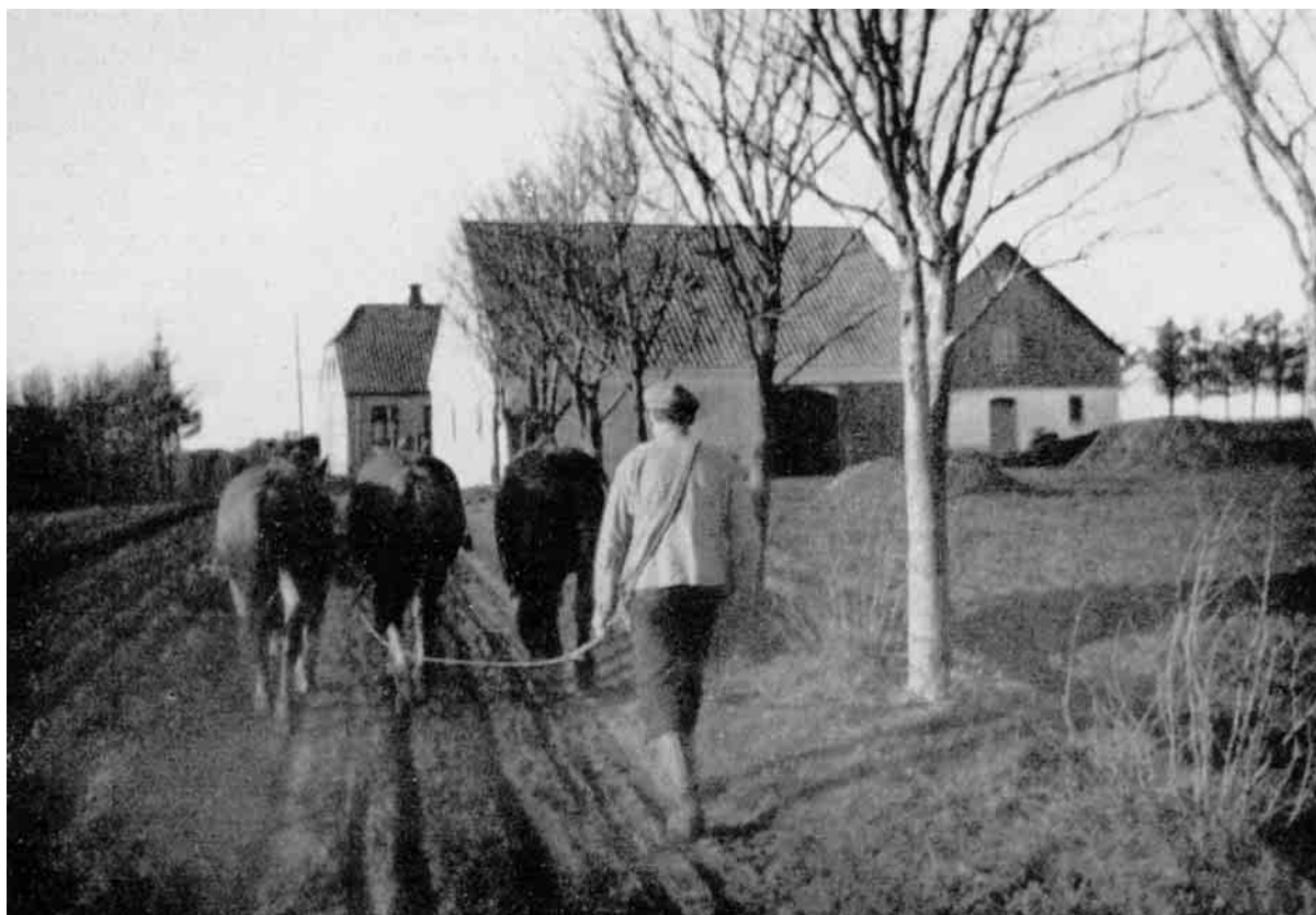
Foraarsarbejdet er i Gang. En Han Herred-Landmand vender hjem fra Markarbejde.

godt i det end fordem Fæsterne, idet Rentebyrderne ofte blev dobbelt eller tredobbelt saa store som den gamle Landgildeafgift, Tienden. Dette bevirkede en yderligere Udstykning, idet den nye Selvejer begyndte Frasalg af Jord for at klare Udgifterne.