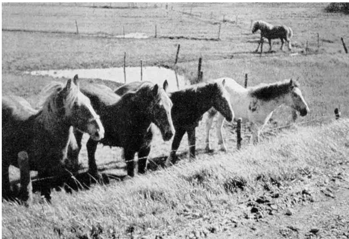
Hestene i Thy er nysgerrige som alle andre Heste. Indvaanerne i en Fenne i Sennels er bleven optaget af et eller andet interessant paa Vejen.

Af Rugsorter er det den gamle danske Rug, eller brun Rug, som danner Grundlaget. Der er færre Sorter Rug end af de øvrige Kornsorter, men en Del Navne findes dog igennem Tiderne. Nu er den almindeligst kendte Petkusrugen, som omkring Aarhundredskiftet kom hertil og siden 1924 er fremavlet paa Livø. I de senere Aar er Livø Petkusrug dog paa de lidt bedre Rugjorder blevet fortrængt af nye og mere stivstraaede Sorter som Staalrug, Kongsrug II og Kortstraaet Petkusrug.