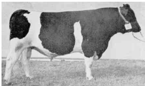
”Fyrst” tilh. Thy Kvægavlsforening for sortbroget jydsk Malkekvæg.