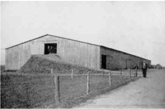
Gaarden Rosvang i Sjørring har en imponerende Ladebygning, en af de største i Landet. Ved Gavlen ses en Rampe for Kørsel til Ladens øverste Del.

Om Planteavlsarbejdet af i Dag kan der være adskilligt at nævne. At Saatiden nu falder et Par Maaneder før, er allerede tidligere nævnt og er egentlig af ret ny Oprindelse, idet man som Begrundelse for Ansøgning om Oprettelse af en Forsøgsstation i 1919 anfører den sene Saatid, omkring 10.-13. Maj, og hvilke Ulemper dette medfører, men ganske vist føjer til, at "Erfaringerne gennem Slægtled har knæsat ovennævnte Tid som den mest heldige." Nu saar man Kornet fra 1 til 2 Maaneder tidligere og Roerne fra midt i April til omkring Maj dag - og faar endda en god Avl. For Landmændene har det været af overordentlig stor Betydning, at de ret tidligt sluttede op om de landøkonomiske Foreninger, hvor de fik Lejlighed til at faa faglige Spørgsmaal belyst og gennemdrøftet, ligesom det lokale Forsøgsarbejde har haft overmaade stor Betydning. Interessant er det at se, at man i gamle Dage - helt saa sent som til omkring 1880-90 - fortrinsvis har haft en 10 Marks Drift, men omkring 1910 nævnes en 8 Marks Drift. Paa dette Omraade har thylandske Landmænd ikke gjort Fremskridt, idet 6 Marks Drift nu er langt den mest almindelige - og intet