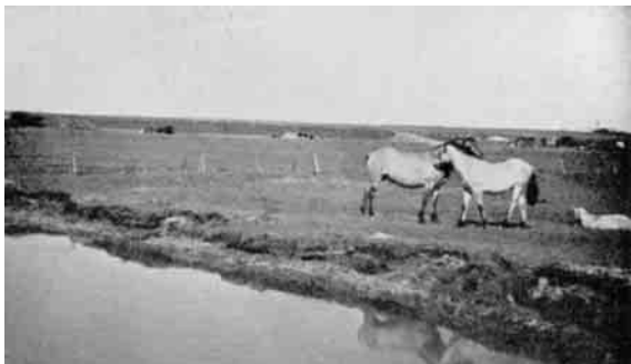
Der er dejligt en Sommerdag ved Bromølle. I Baggrunden ses Kløv Bakke.

Kettrup og Omegns Hesteavlsforening har bl. a. haft "Kettrup Fjandbo", Reg. 598, og "Kettrup Billeskov", Reg. 1122. "Kettrup Fjandbo" har 1. Pr. Kredsskue og Afkomspræmie 2. Kl. 1. Gr. 1940 for en Samling ret ensartede Plage med godt Præg, ret god Bredde og Dybde, ikke sjælden lidt flad Skulder, trivelig Midtstykke, Ryggen ikke kort, men stærk og lige, bredt Kryds, undertiden lidt spids til Halen, fyldige Laar, gode, lidt stærk bøjede Haser, ret velstillede Forben, men mangler ikke sjælden Muskelfylde paa Underarmene, gode Hove. Bevægelsen jordvindende. Langt Skridt og kraftig Trav af og til noget snæver for.