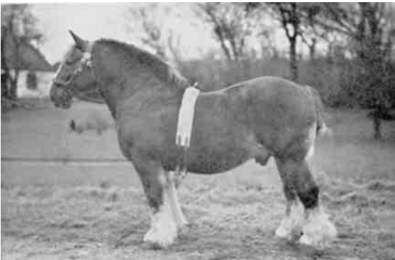
”Knægten”, tilhørende Hassing Herreds Hesteavlsforening (fot. 1946).

I 1945 er RDM. for første Gang i Flertal ved Dyrskuet i Thisted.