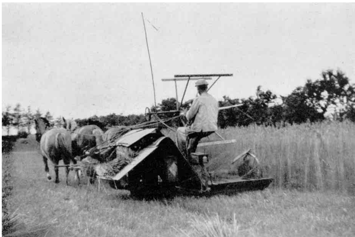
Landbrugets Mekanisering skrider stadig frem. Her falder Sommersæden for Selvbinderens Knive.

samme Handel, stikkes et Skaft horisontalt ind i en Krampe paa højre Handel. Med den venstre Haand paa dette Skaft og den højre paa Knagen styrer Plovmanden Ploven". Det synes, som man har været særlig glad for denne Plov, fordi "Modbydeligheden for at gaa i Furen behøver Thyboen ved denne Plov ei at overvinde, da den styres paa Land".