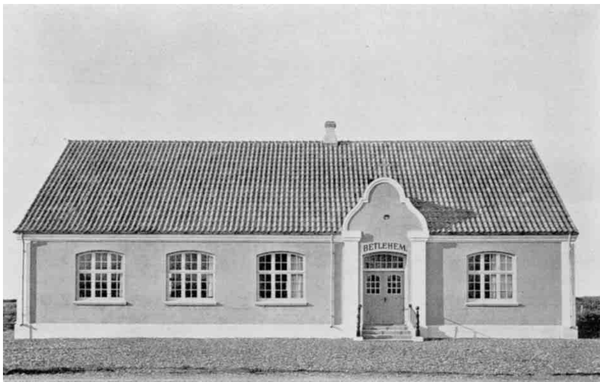
Klitmøller Missionshus, opført 1916. Et af Egnens smukkeste og mest anselige Samlingssteder for Indre Mission.

og var i Begyndelsen indviklet i haard Kamp med Myndighederne; men efter Grundloven af 1849 faldt enhver statskirkelig Tvang bort, og Baptisterne kunde frit missionere. Især i Vendsyssel tog man ivrigt fat, og sidst i 60'erne begyndte Prædikanter derfra at udstrække deres Virksomhed til Thy. Saaledes gjorde Forstanderen for Jetsmark Baptistmenighed mange Prædikerejser til Midtthy og Thyholm. Men ogsaa andre virkede. Der meldes 1874 om Møder paa Thistedegnen og i Skyum, og flere lod sig gendøbe. I 1875 besøgte Forstanderen for Københavns Baptistmenighed Thy og beskrev selv sin Rejse saaledes: "Jeg har besøgt Aalborg, Løgstør, Jetsmark, Hals og Frederikshavn. Det bedste Sted, jeg har været, er dog Thyland, hvor jeg havde den Glæde at døbe 7 Personer. I 4 Uger holdt jeg ikke mindre end 28 Forsamlinger. Den sidste var uden Tvivl besøgt af hen ved 150 Sjæle."