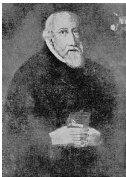
Frants Berg, Læsemester i Vestervig, senere Biskop i Oslo.

Klosteret; men dersom de vilde blive, maatte de underkaste sig Regler, som ikke var i Modstrid med den evangeliske Kirkeordning. De skulde som før synge deres Tidebønner, men efter en Forskrift, som Bugenhagen havde forfattet efter bibelske Tekster. Det katolske Helgenvæsen og Messeofret afskaffedes, og der skulde holdes Altergang paa luthersk Vis. De maatte bære Munkedragt, men ikke være kronragede, skulde være Klostersforstanderen lydige, leve et godt og ærligt Levned, flittigt høre Prædiken og læse i Bibelen, "at der maatte end være nogen, som her efter maatte vorde Sognepræst". Derfor skulde Klosteret have en Læsemester, en god og lærd Mand, som skulde holde Forelæsninger over den hellige Skrift, prædike og lære Børnelærdom. Disse Bestemmelser mødte nogle Steder aabenlys Modstand, og mange Steder gik det kun langsomt med deres Gennemførelse. I Vestervig spores ingen Vanskeligheder, uden Tvivl fordi Reformationen her væsentlig var gennemført forinden. Allerede 1536 var saaledes paa Provst Svends Begæring en af Reformationens gode Mænd, Frants Berg , blevet Læsemester i Vestervig. Frants Berg, der var en anset og højlærd Mand, var ved Universitetet i Rostock blevet grebet af Lutherdommen. Han virkede i Vestervig til 1540. Fra 1548 var han Biskop i Oslo, hvor han gennem en Menneskealder kom til at øve en betydningsfuld, reformatorisk Indsats.