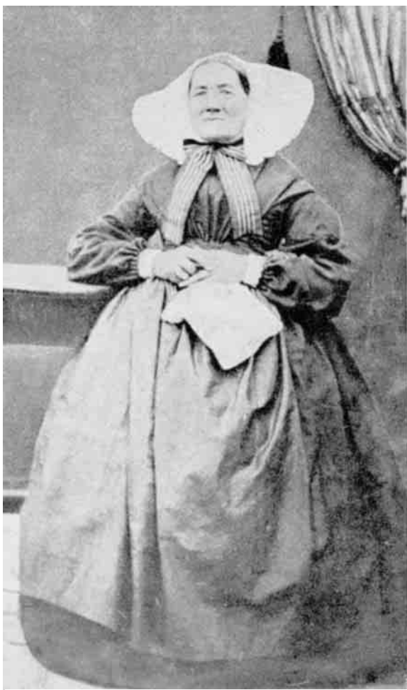
Fig. 13. Vingekappe fra Thy. 1860'erne. Museet for Thisted og Omegn.

og gadedøre for at redde stadsen fra ødelæggelse. Paa den anden side kan man vel knap tænke sig