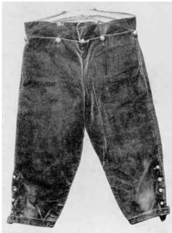
Fig. 2. Knæbukser af brunt "manskettes" (manchesterfløjl) fra Fjerritslev. Dansk Folkemuseum.

Efter skifterne at dømmé har vesten gennemgaaende været af simplere stof end brystdugen. Det maa altsaa antages at vesten har været daglig paaklædning. Det er ogsaa sjældent at træffe veste med sølvknapper. Det almindeligste var knapper af tin, kamelhaar eller uægte metal.