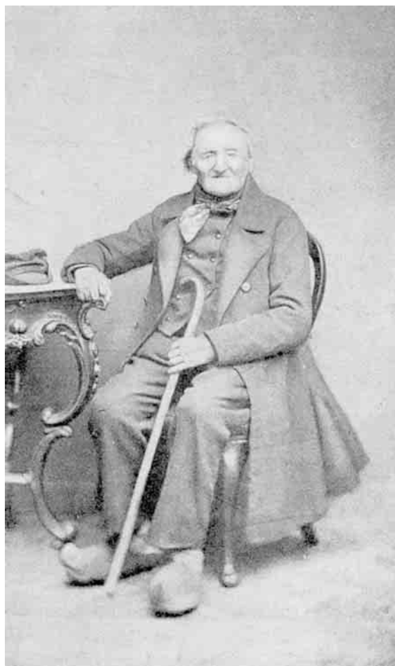
Fig. 6. Mandsdragt. 1860'erne med lang frakke og træsko. Skaarup.

M. Rørbye: Skitsebogen. Thisted 1830. Kobberstiksamlingen.