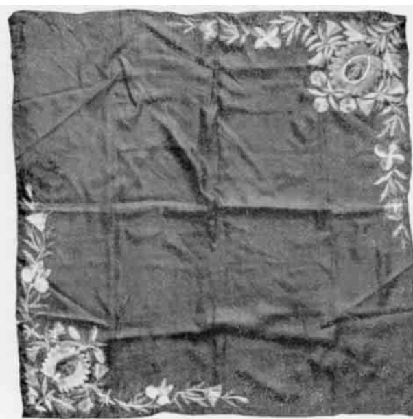
Fig. 9. Tørklæde af sort silke med broderi i sørge- og glædesfarver. Dansk Folkemuseum.

Forklæder . Til en standsmæssig garderobe hørte i det 18. aarhundrede et sort forklæde af rask (et uldent ret tarveligt stof). Det har