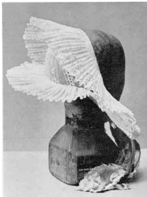
Fig. 12. Vingekappe, hvidt tyll med broderi og tønderkniplinger. Dansk Folkemuseum.

Det var meget vanskeligt at gøre disse kapper i stand. De skulde pibes og stives med stor omhu for at kunne staa vandret ud fra hovedet, og der fandtes i landsbyerne kappekoner, der var specialister paa dette omraade. Naar kvinderne gik til kirke eller fest, bar de hovedtøjet i en kappekurv og tog det først paa, naar de kom frem. Dette var en nødvendig forsigtighedsforanstaltning, da "storreluen" ikke taalte den mindste smule fugtighed, før den klappede sammen og hang ynkeligt slaskende ned om kinderne. Paa de store markedsdage i byerne skal det have været et komisk syn at se