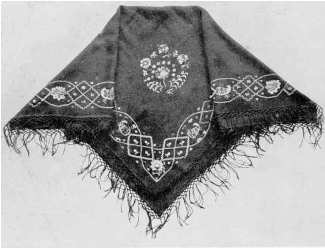
Fig. 14. Uldent sjal, brunlilla bund med broget uldgarnsbroderi. Dansk Folkemuseum.

Den hele kjole er aldrig helt forsvundet fra folkedragten. Paa empiretiden kom den igen paa