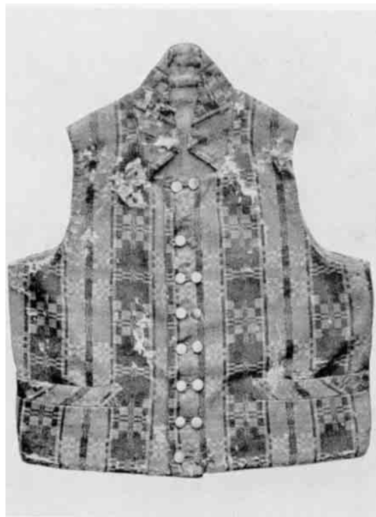
Fig. 4. Mandsvest af drejlsvævet hvergarn, rødt og grønt. 1830-40'erne. Hurup. Dansk Folkemuseum.

silkeklæder med hvidstribet bort (gange), de brugtes baade af mænd og kvinder og kaldtes for "mallændere", hvilket vel maa betyde, at de oprindeligt har været fremstillet i Milano 8 ). De har været meget yndede baade af mænd og kvinder, saavel til hoved- som til hals- og mundklæder.