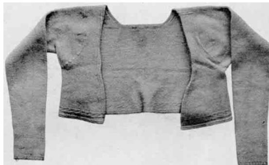
Fig. 7. Nattrøje strikket af rødt Uldgarn. Boddum. Dansk Folkemuseum.

Under livstykket bar man strikket nattrøje , eller man kunde have strikkede ærmer syet fast i ærmegabene, det sidste var mindre varmt end en hel ulden trøje. Ved haardt arbejde, til dans og i stærk sommerhede kunde man unnlade nattrøjen og bære livstykket direkte ovenpaa den langærmede særk. Men det blev regnet for en lidt nonchalant paaklædning, der absolut ikke kunde bruges ved mere formelle lejligheder. - Nattrøjen var strikket (bundet) af uldgarn, som oftest rundstrikket, dog kunde den ogsaa være aaben fortil (fig. 7). Rødt var den foretrukne farve, "højfarvet", som det undertiden kaldtes. Ogsaa karmoisinrøde og kraprøde trøjer brugtes. Foruden de røde forekommer ogsaa grønne nattrøjer i skifterne. Derimod omtales blaa kun yderst sjældent. En enkelt gang omtales nattrøje med sølvknapper. - Strikkede trøjer af uld eller silke har været brugt i overklassen som hjemmedragt eller undertøj i det 17. og 18. aarhundrede 17 ) og er herfra gaaet over i folkedragten. De omtales først i skifterne et