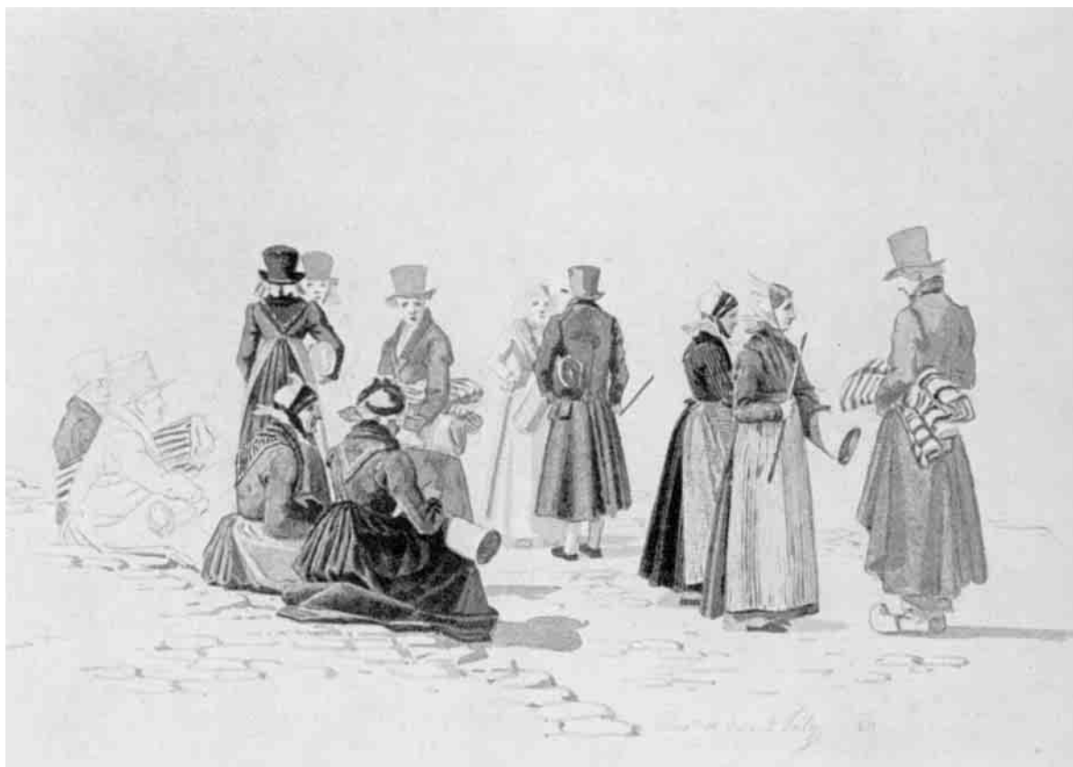
Fig. 1. Høj kvindehat. M. Rørbye. Thisted 2. Juli 1830. Kobberstiksamlingen.

Efter skifteprotokollerne at dømme har det egnspræg, der karakteriserer folkedragten, først udviklet sig henimod slutningen af det 18.