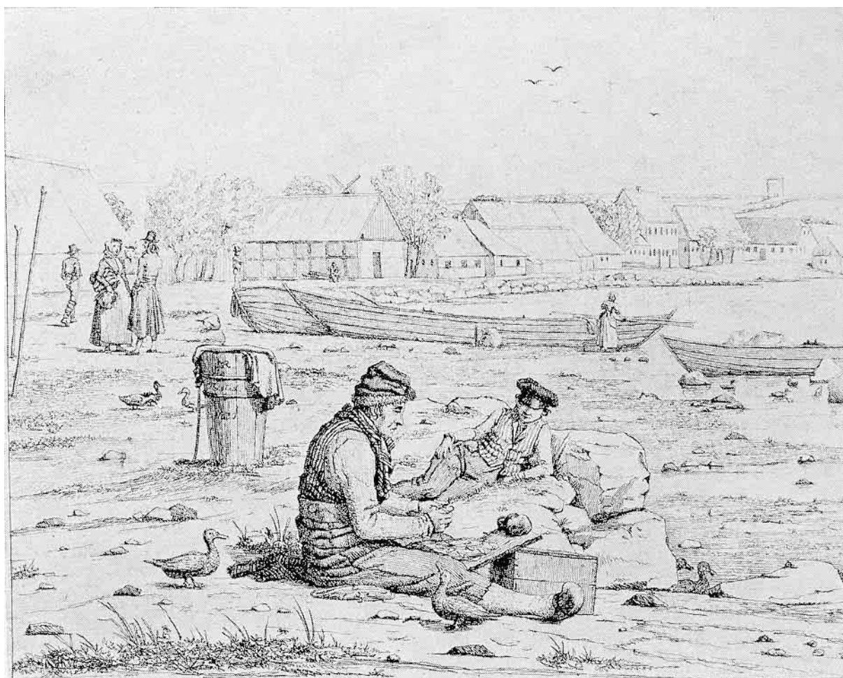
Fig. 5. Daglig Mandsdragt. M. Rørbye: Strandgaden i Thisted 1830. Rejsedagbogen (ved Goerg Nygaard).

midten af aarhundredet. Ofte forede man tøj med barked skind i stedet for med lærred for at holde den gennemtrængende blæst ude 10 ). Paa Klim snapsting, der varede i tre dage, kom en feldbereder (garver) fra Nibe for at udlevere og modtage skind til klæder 11 ). Skindtøj var nu udelukkende hverdagsdragt. Til denne kunde man ogsaa bruge korte blaa vadmelstrøjer og vide lange bukser af graat vadmel. Ovenpaa skindbukserne bar mændene ofte lange lærredsbukser for at skaane skindbukserne. Man afbarkede skindet ved at grave det ned i faarestien og lade det ligge saa længe, til al ulden kunde skrubes af. Fattigfolk vævede dyner af