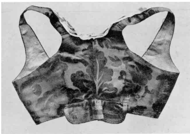
Fig. 11. Empirelivstykke af blaat silkedamask med rosa silkebaand. Dansk Folkemuseum.

Ogsaa paa kvindernes dragt øvede empiretiden sin indflydelse. Livet og bullen blev ganske kort (fig. 11) og skørtet langt og snævert. De stive, hjemmevævede stoffer, der stod til bønderkvindernes raadighed, passede kun daarligt til empirens slanke mode og gav et underligt forvokset udseende. - Selv om landalmuen til en vis grad følger købstadmoden, gaar der dog lang tid, inden en modenyhed har vundet indpas paa landet, og empiremoden trængte da heller ikke virkeligt igennem før