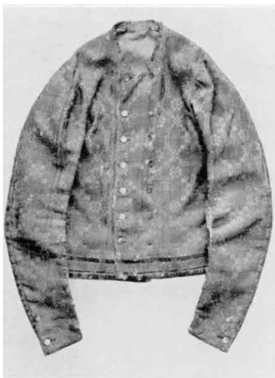
Fig. 3. Mandstrøje af drejlsvævet hvergarn, rødt og grønt. 1830-40'erne. Hurup. Dansk Folkemuseum.

Paa Fødderne havde mændene til stads ske med metalspænder - helst naturligvis sølv - eller lange støvler . Til daglig hvide træsko med blanke kramper, ligesom kvinderne.