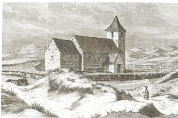
Tved Kirke i Thy, tegnet af Magnus Petersen i 1875. Gengivet efter Illustreret Tidende, 5. December 1875.

Til nærmere Oplysning om Sandflugtens Historie kan anføres: at i 1671 skal Agger Sogn have udgjort så meget som 50 Tdr. Hartkorn. I Lodbjerg Sogn var tilforn en stor Gård kaldet Rotbøl og en By kaldet Skovsted , som bestod af 6 Gårde og 5 Huse. I Hvidbjerg Sogn vesten Åen, ligeledes en By ved Navn Alstrup. Men ved opmålingen 1688, fandtes Agger Sogn så ødelagt, at det ikke kunne sættes i Matrikel og de andre benævnte Steder var på samme Tid gjort øde af Sandflugten. Efter 1688 og indtil 1770 er 48 Tdr., 2 Skpr., 2 Fdkr., 2 ½ Alb. Hartkorn blevet ødelagt af Sandflugten i følgende Sogne. Efter Synsforretning 1732 og