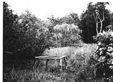
1435 1 MARIE-MAGDALENE KILDE, Dragstrup s.

Ejeren af Mårbjerggård, Frederik Bülow påv. kildens pl. til Hemmert Lund, Skive 1978. Trap V bd. VI 2 , 737. Schmidt DH 134, 37. Litt: Morsø Aarb. 1920, 88. 1925, 123. DFS 1906/31. Trap 4 V, 470.