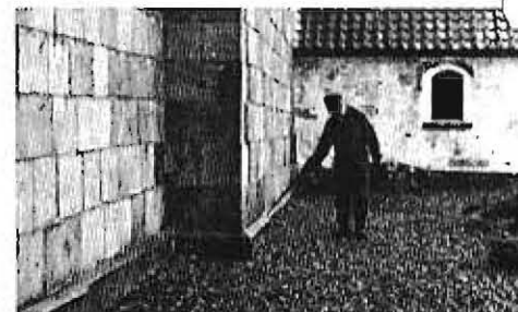
1318 Sct. Bodils kilde, Tømmerby s. Kirkens graver viser forskydningerne i kirkens mur.

Historie. Sagnet er rigt på oldtidshøje, hvoraf flere anselige omkr. H.H. Kilden er senere