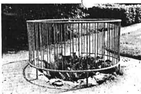
1391 1 Sct. THØGERS KILDE, Vestervig s. Kildebrønden med navnesten på den gl. kirkegård.

Historie. Sagnet fortæller, at kil-den ansås for hellig, fordi den ud-