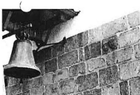
1439 MARGRETHE KILDE, Flade s. Granithovederne på kirkens vestgavl.