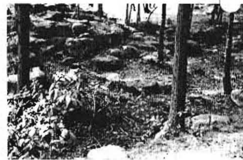
1411 1 Sct. Hans kilde, Nykøbing M.