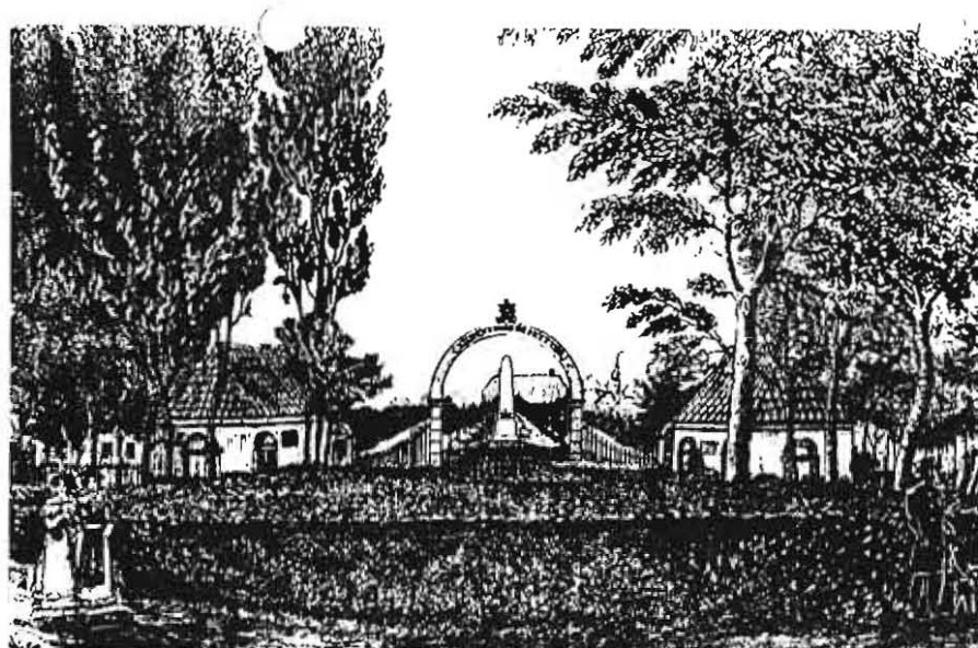
Indgangen til »Kilden« ca. 1830. I buen over indgangen ses Fr. Vls kronede monogram med ordene: »Kildens høje Beskytter«. Teg. fra Aalborg Bys Historie.