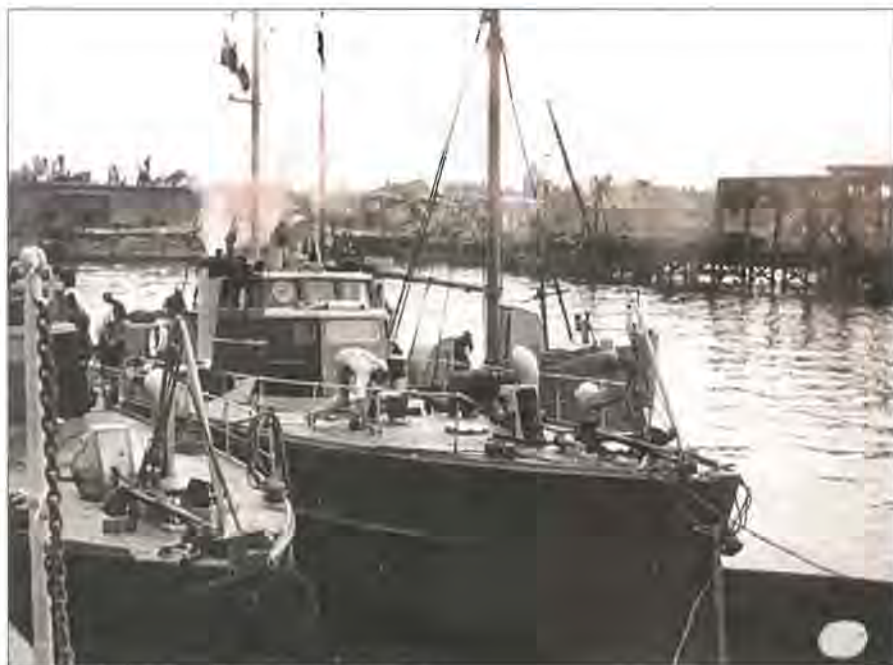
De to reddede ministrygere, MS 3 og MS 5

De danske skibe blev sejlet hjem til København. Eneste undtagelse var de fire torpedobåde af DRAGEN- og GLENTEN-klassen, der efter tysk pres var blevet udleveret til den tyske flåde i februar 1941. 1 Fire af bådene blev genfundet i Flensborg. Torpedobådene var dog desværre