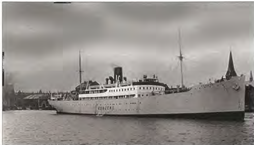
DFDS Esbjerg fotograferet før krigens udbrud.

Skibene forlod sammen med MS 3 Lübeck den 23. juli, men allerede næste aften fik MS 3 motorstop og måtte tages på slæb af Esbjerg. Skibene fortsatte dog mod København, kl. 2230 løb Esbjerg på en mine lidt syd for Stevns. Ved eksplosionen blev slæbetrossen mellem MS 3 og Esbjerg revet over, og MS 3 begyndte straks at drive væk. Da al strømmen var forsvundet ombord på Esbjerg, søgte besætningen på MS 3 at signalere til Parkeston at Esbjerg var ved at synke. Des-