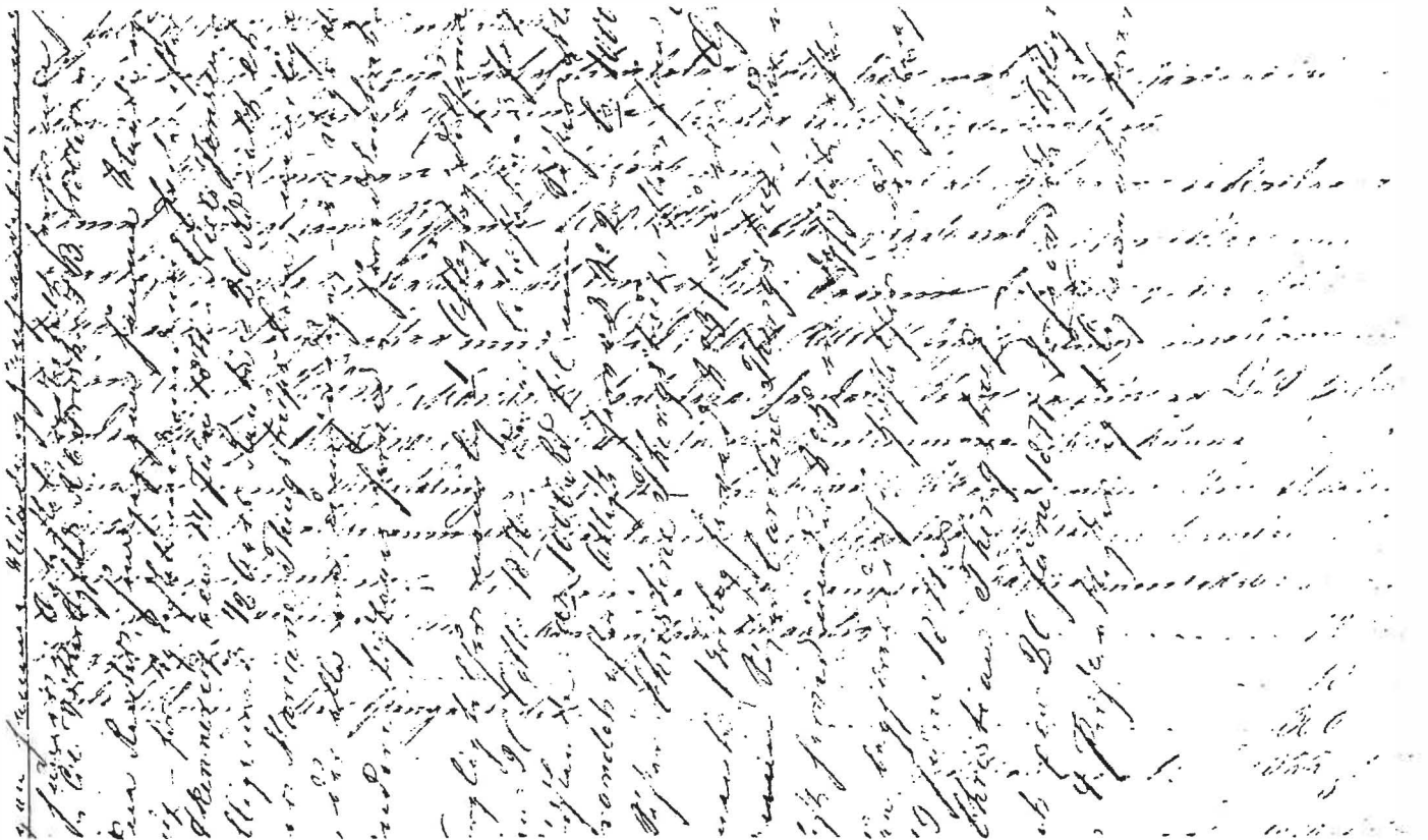
Fotoudsnit af skøde- og aftægtskontrakt