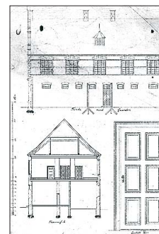
ET FORARBEJDE fra 1851 til det gamle rådhus på Store Torv i Thisted.