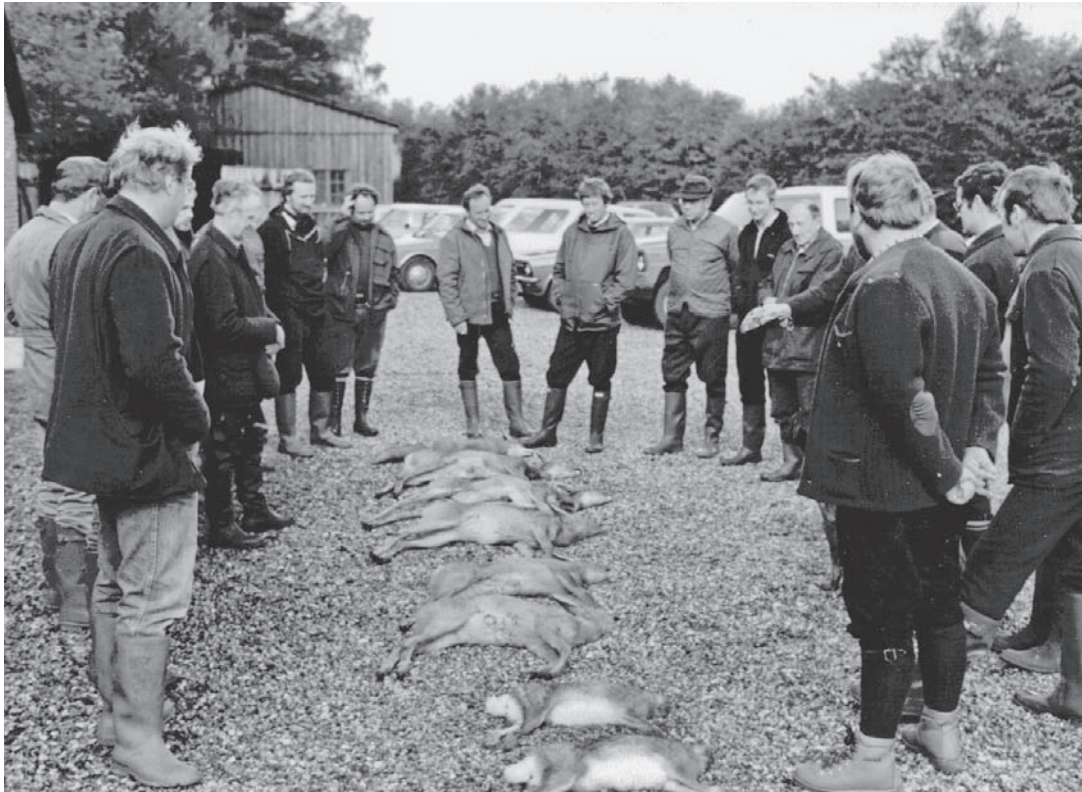
Vildtparade i Lodbjerg plantage, engang i 1980'erne: