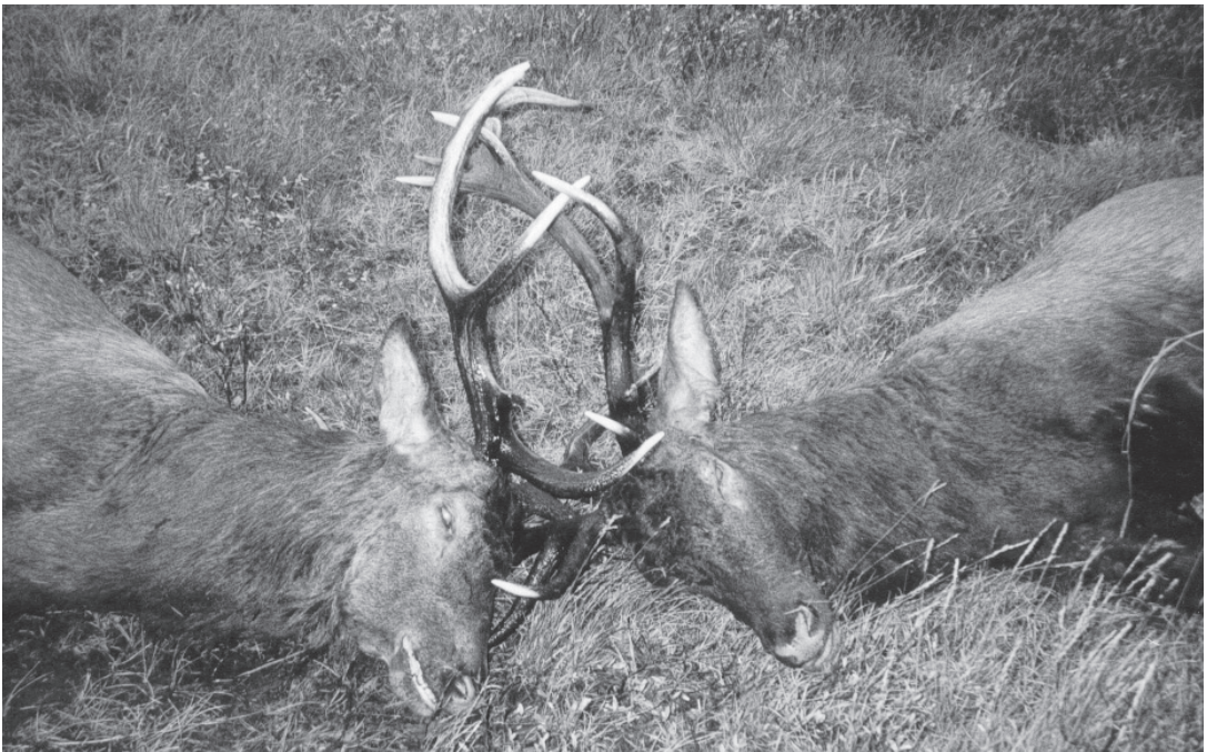
Drama i naturen. To hjorte omkommet under brunstkamp i Uglkjær.