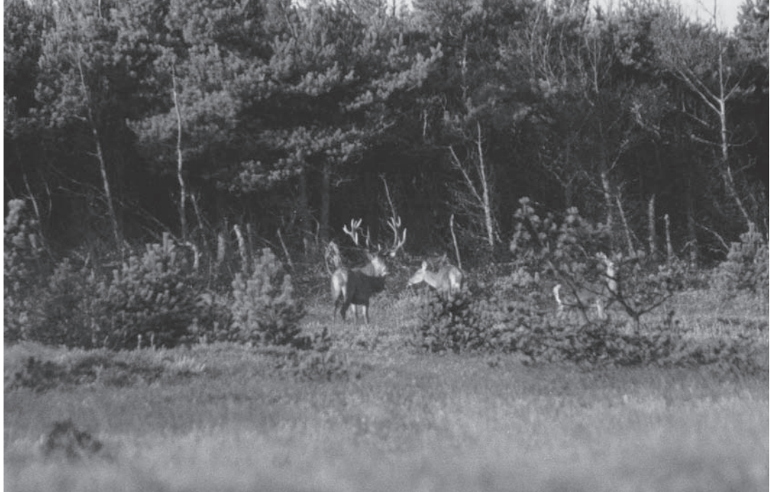
Pladshjort ved Uglkjær, også kaldet "Murermeister Kjar". Derfor fik den store hjort navnet "Murermesteren".

og udsætte vildt i plantagen efter behag. Ved kontraktens udløb skulle der indbetales et beløb til at udsætte vildt for i plantagen. Tobaksrygning var af gode grunde forbudt på grund af brandfaren og overtrædelse medførte bøder og udelukkelse af jagtselskabet.