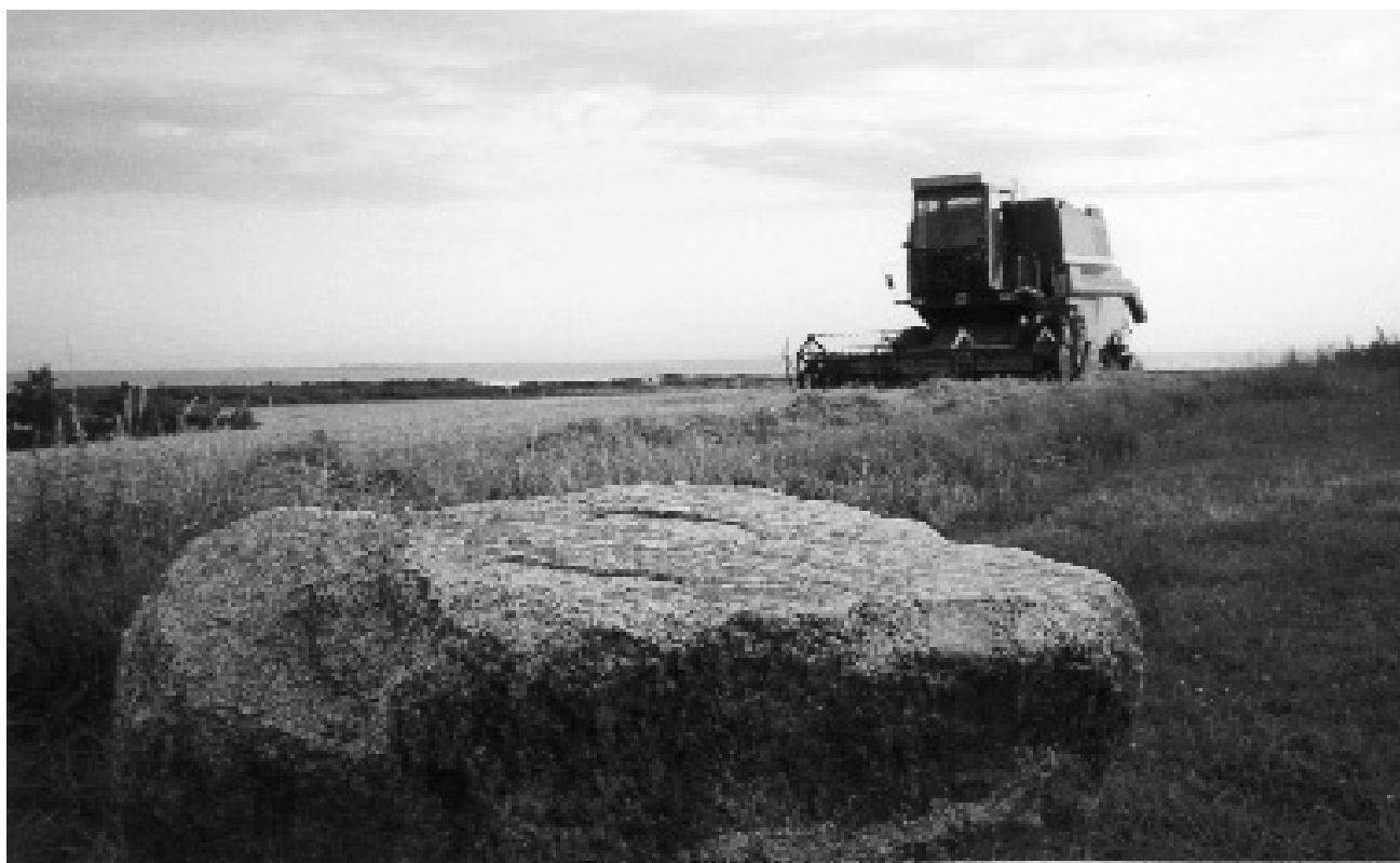
Danastenen i Danas Have, oprindeligt centrum for Kornmodsfesten 1. august til sikring af en god høst.

onde Øje og dermed er det forbi med lykke og velstand i Irland. Danafolket ender i irsk folkløse som underjordiske alfer, elverpiger og bjergfolk i høje.