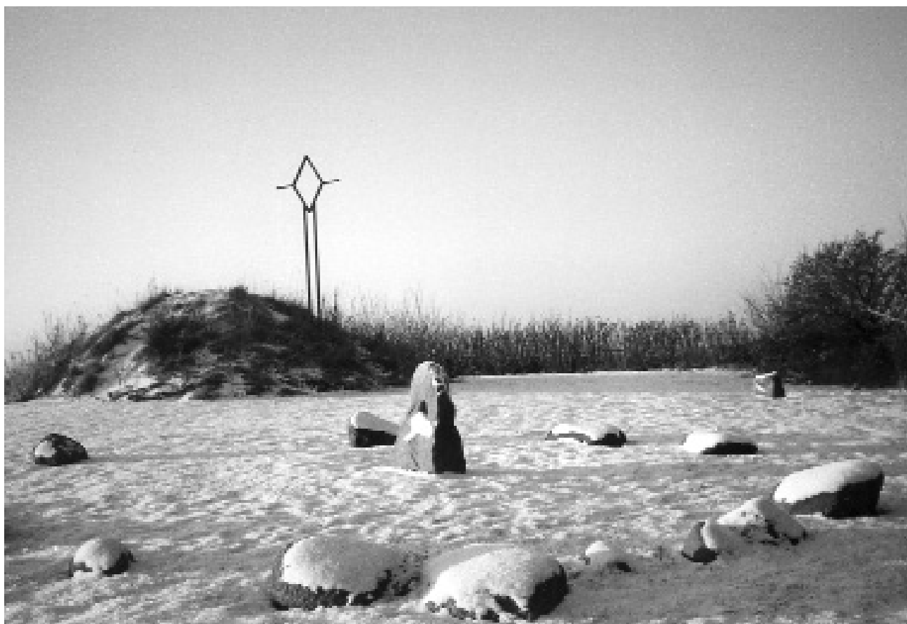
Tingstedet og Korshøjen, rekonstrueret i Danas Have. Højen stod »på gloende pæle« 1. november (Halloween) ved mørketidens begyndelse. Dise-tinget holdtes i februar. Korset er det gamle nordiske symbol for den genopstandne sol.

At en korn gudinde dyrkes såvel af bønder