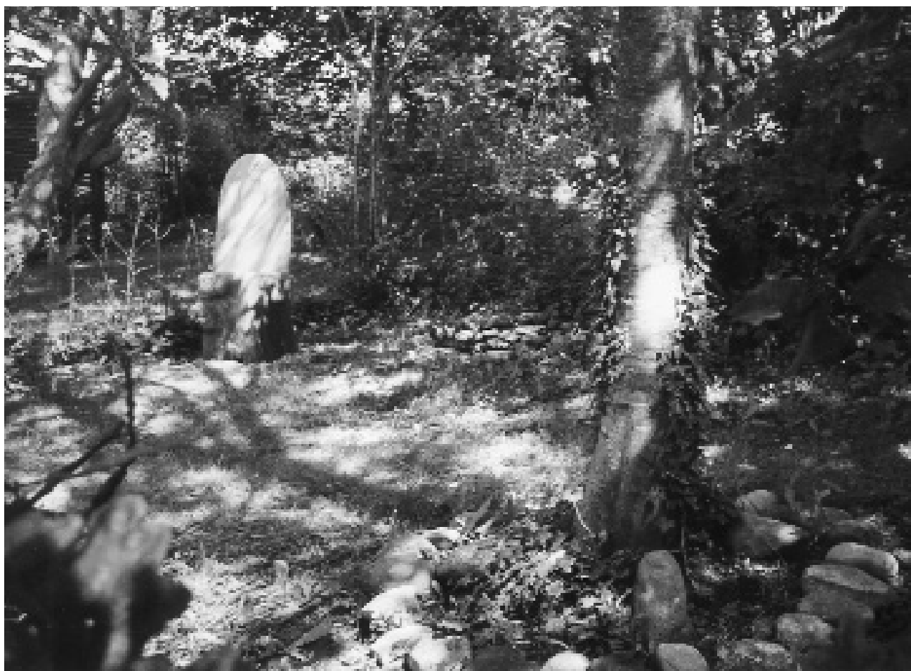
Verdenstræet Ask Yggdrasil, nornernes brønd og tulens stol.

stillingsverden. I et antikvariat med yderst rimelige priser faldt mit blik på en bogryg med titlen Celtic Mythology. Jeg pillede den ud. På omslaget var et stort billede af: Gundestrupkarret, fundet i Rævemosen i Limfjordslandet Himmerland, kimbrernes hjemland!