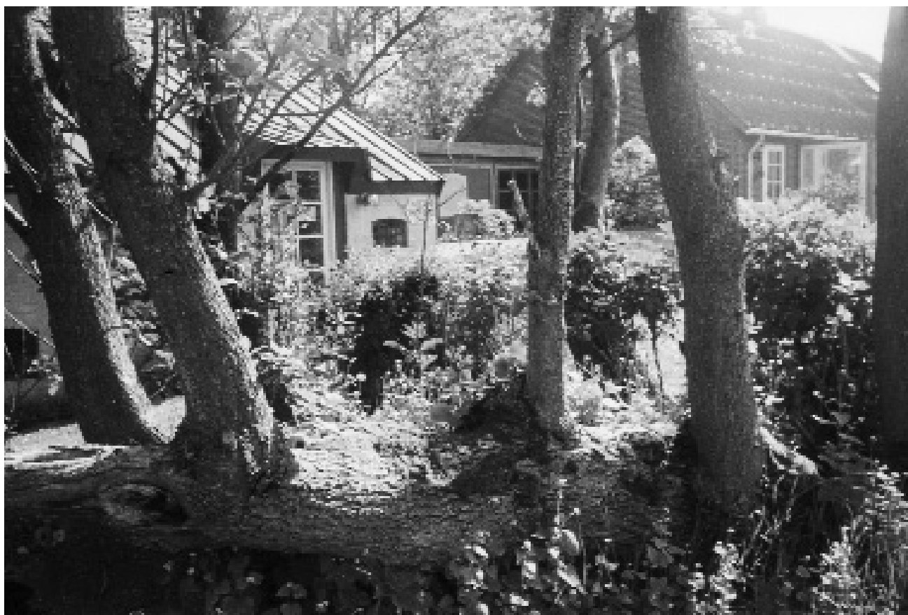
Lunaria, Korshøjgård, set gennem poppeltræer. I mytens verden er poplen Tiden, Rummet og Dybets gudinde, som af længsel efter Dagslysets unge gud græder tårer af rav.

for en jysk skabelsesmyte fra vikingetid, sågar noget så usædvanligt som en dobbelt skabelsesmyte. Myten om Limgrim fortæller ikke alene, hvordan Limfjorden blev skabt, men også hvordan dens skaber blev til, soen Limgrim.