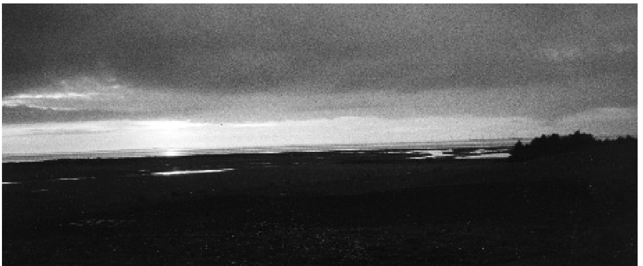
Limfjordens skabelse, set fra Danas Have.

Under alle omstændigheder, jeg fornemmede helt klart, at jeg med Limgrim-sagnet stod over