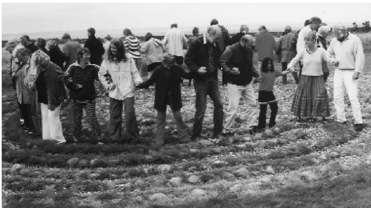
Tranedans i den stenlagte labyrint, oprindeligt en fejring af forårsgudindens udfrielse af vintergudens vold.

I Frankrig, i det keltiske Gallien, blev en ræv til tider brændt på Midsommerbålet. Bagefter samlede folk gløderne op og bar dem hjem - de bragte lykke.