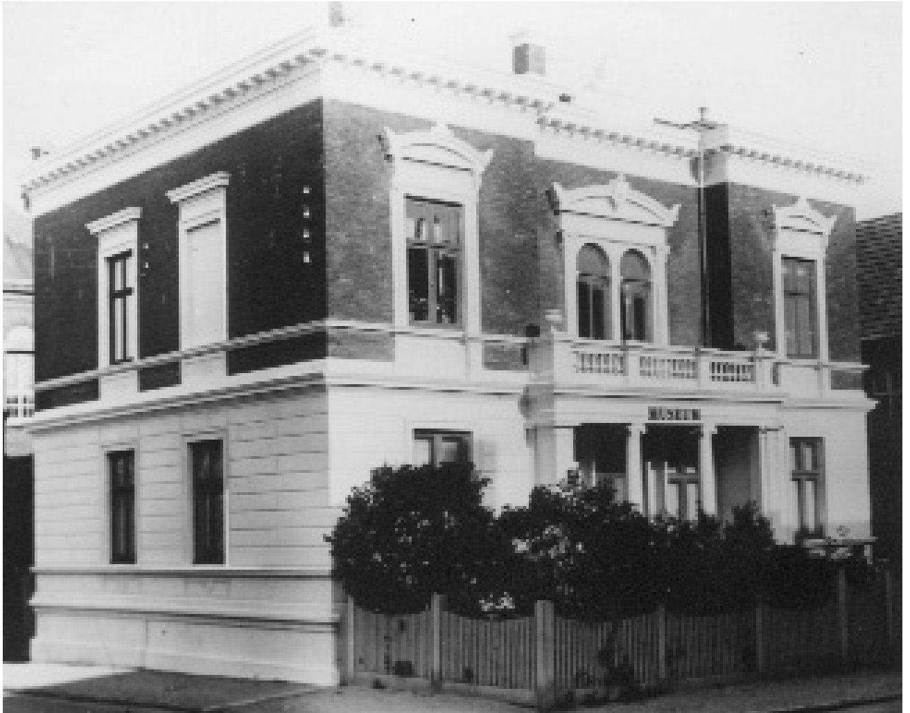
Huset i Skolegade, hvor der var museum i mellemkrigsårene.