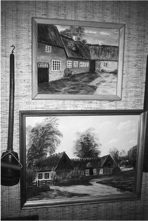
En af mine store interesser er at male. Her har jeg forevigtet en meget gammel gård fra Søndbjerg på Thyholm 1987. Samt en gammel Skånegård, malet 1979.