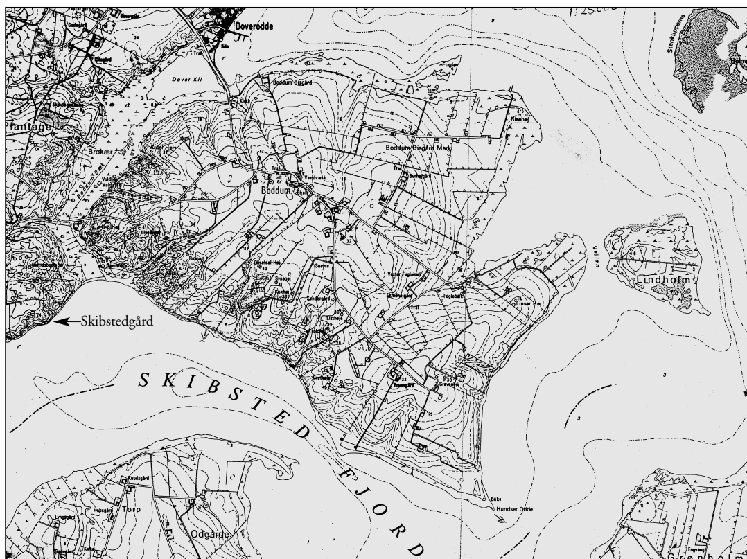
Kort over Boddum. Bemærk færgestederne, der er afmærkede med pile.

Dette er blevet til adskillige store private