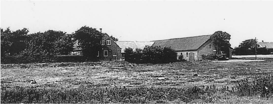
Vestergaard set fra Havrelandsvej i Søndbjerg på Thyholm.