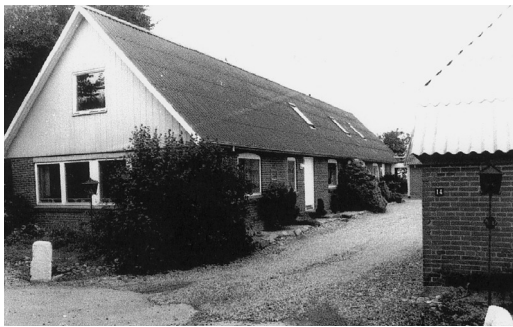
Ved Gården Højbjerg på Sinderupvej mellem Sinderup og Hurup - 1995.