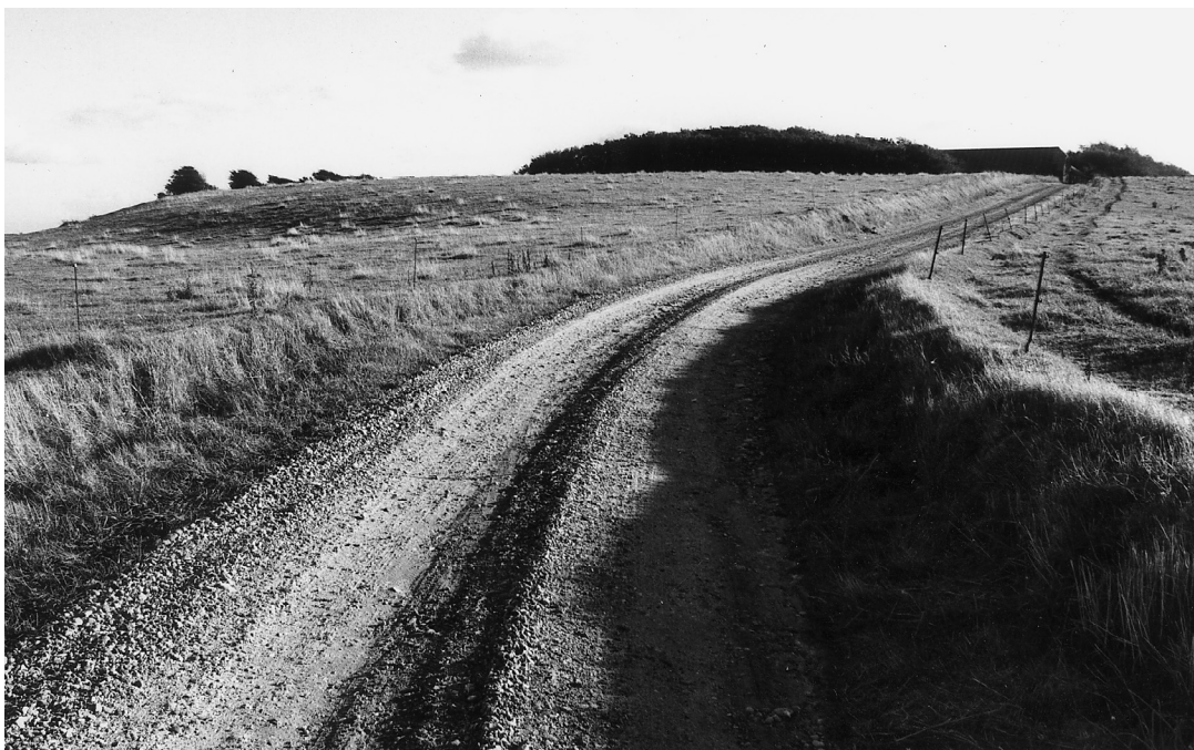
Her i dette i dette smukke landskab med Limfjorden under bakkerne til venstre og Dover Møllegaard i træerne i billedets baggrund lå i sin tid Dover vandmølle.