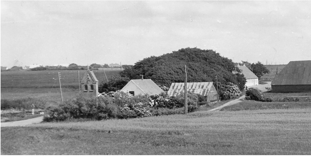
Holmgaarden ved Holmgårdsvej i Ydby sogn.

stensen. Købt i 68 sammen med gården Sdr. Raakjær for i alt 1400 rd.