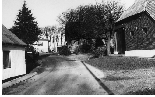
Begge billeder herover er fra Ballevej i Søndbjerg. Til højre i baggrunden tildels skjult af den høje græsses en villa, der i dag ligger på pladsen, hvor Ballegård lå indtil branden 1901, da den blev flyttet længere mod nord på samme vej - billedet til venstre. I dag nedlagt landbrug.

Til videre oplysning for læseren skal bemærkes, at jeg jo i stoffet fremover beskæftiger mig med tiden mellem 1720 og århundredskiftet. Altså er vi midt i den såkaldte stavnsbåndstid med hoveri og fæstevæsen og megen ufrihed for landbobefolkningen. Mange mænd var ofte til rådighed for militærvæsenet i 10 - 20 år og som følge heraf ude af stand til at forlade hjemstavnen. I dette gods er der tilsyneladende ikke hoveriarbejde at udføre, man afregner kontant ved erlæggelse af den årlige Landgilde.