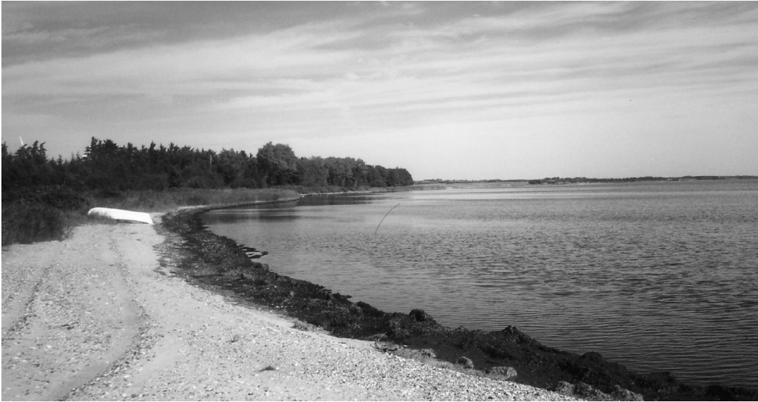
Limfjorden ved Visby Bredning.

marker efter erindringen, anbringer iskagehuse, hønsrier, vindmotorer, jernbanebomme og ledvogterhuse med børnetøj til tørring, man brolægger og makadamiserer (vejbelægning med tjære og småsten - ikke asfalt - jjb) veje og strør bondgårde og kirketårne ud over landskabet. På et kort, hvor Damhussøen fylder en hel centimeter, er der ingen grænser for, hvad man kan få med". Fra essayet "Danmarkskortet".