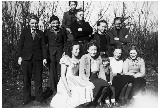
Sidste skoledag, april 1948.

Det var en dejlig tid vi kom til at opleve med præstegang. Pastoren mente at vi nok i de