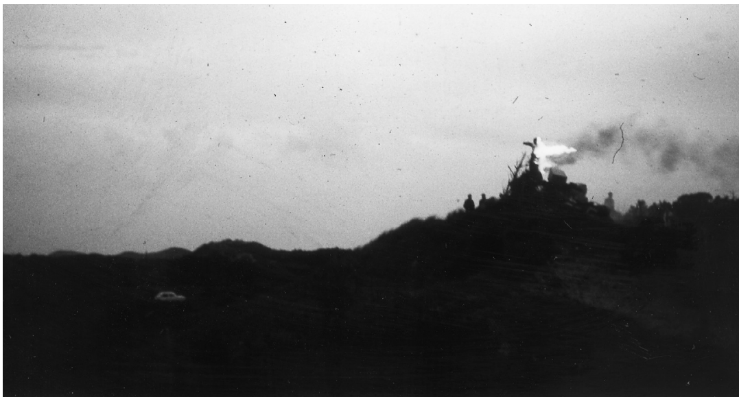
Sankt Hans aften.