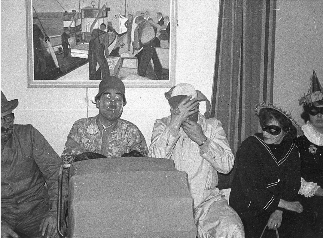
Fastelavnsfest i forsamlingshuset.

hende mellem hendes ben. De var begge lidt flove over det, men det var der nu ingen grund til. Optrinet gjorde tilsyneladende stor lykke på de andre balgæster.