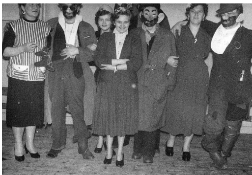
Fastelavnsfest i »Haabet« 1957.

De problemer havde vi dog ikke, vi måtte og kunne underholde os selv. Til fastelavn gik alle