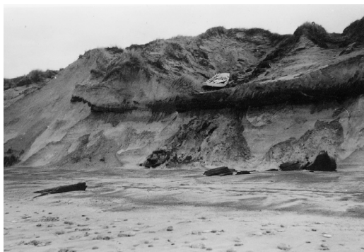
Min pram efter en storm. Så meget har havet taget af klitten på een nat. Da vi løfede båden op skrånede stranden jævnt op

Vi fulgtes ad ned til landingspladsen og talte om, at blot vi ikke fandt et lig, som skulle slæbes op, var det vist ikke så slemt. Derpå skiltes vi og gik hver sin vej. Hvis ikke det havde stormet så meget, havde håret vist stået