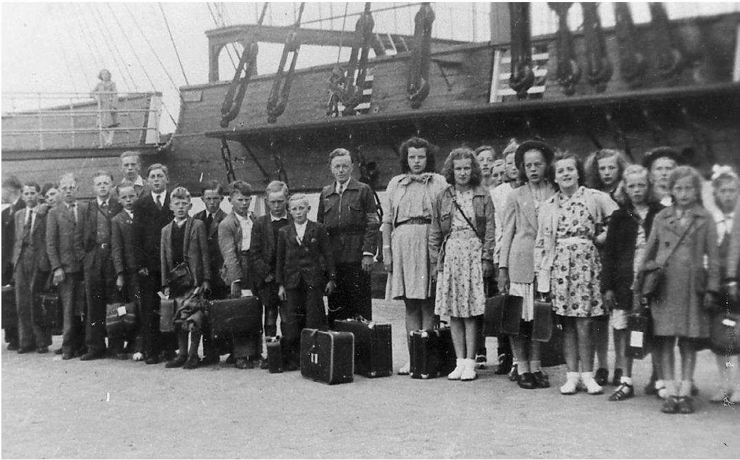
Udflugt til København foran fregatten »Jylland«.

havende, så jeg mente det nok gik an, og jeg havde den hjemme i sparebøsse så jeg kunne betale senere, hvad jeg også gjorde.