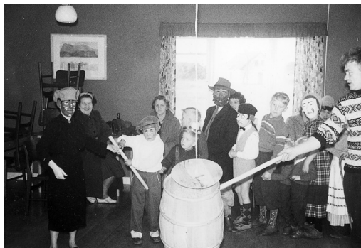
Katten slås af tønden.

unger selvfølgelig rundt med masker på og der var tøndeslagning m.v. i forsamlingshuset om eftermiddagen. Om aftenen var der så bal for de voksne, og de fleste var klædt ud. Så det var morsomme fester. Det skete også, at vi var nogle stykker som klædte os ud og gik på besøg rundt om. Da var det ikke så praktisk at have maske på, for så kunne man ikke drikke den budte genstand og det var jo da den vi var kommen efter at få. Men vi kunne nøjes med at tage en næse på samt kunstige ører og lignende, og så sværte sig for resten, så var det nemmere med konsumeren. Nogle piger var gerne klædt ud som mænd, og vi som piger, og at nogle af de friske yngre husmødre, som vi var på besøg hos, ville føle efter, om vi nu også var piger gjorde ikke så meget for os ungarles skyld. Det gik for sig med megen grinen og løben rundt i stuen.