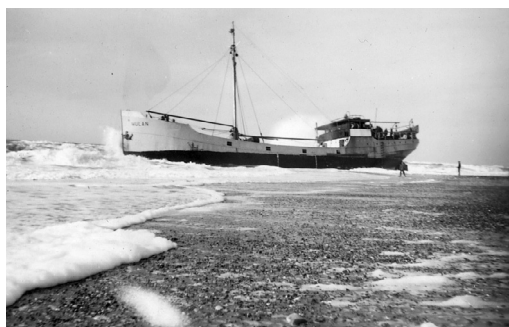
M/S Mulan af Rotterdam. Stranden 28. feb. 1953.

Skibet var S/S Mulan af Rotterdam og var lastet med jern. Da jeg kom hen til strandingen, var der allerede masser af mennesker samlet, og redningsmateriellet fra Lyngby, var forlængst ankommet. Der var ellers ikke meget at gøre lige i øjeblikket, for folkene var jo iland, og lasten kunne ikke sådan lige losses. Vejret skulle være ordentlig, inden lugerne måtte åbnes og en last af svære jernbjælker og jern-