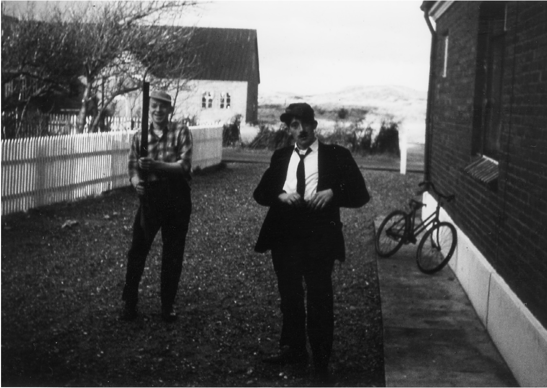
»Det var alligevel ikke Adolf Hitler«.

udhvilede til hverdagen som nu begyndte igen.