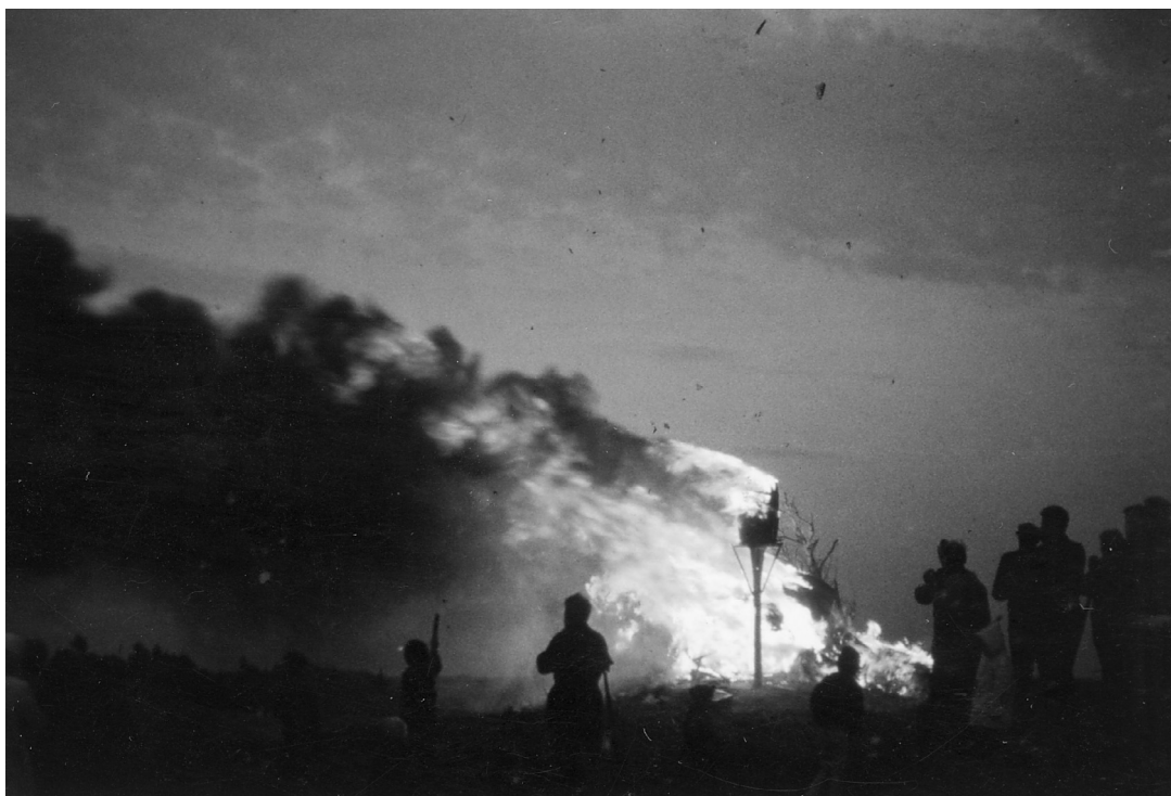
Sankt Hans aften.

Meget tidligt om morgenen, kom mor ind på mit værelse og vækkede mig. Hun spurgte, om jeg virkelig ikke havde hørt det postyr der havde været i huset om natten. Jeg måtte indrømme, at jeg ingenting havde hørt. Joe, for vi havde en stranding, et hollandsk motorskib, og far og bestyrelsen for bjergelaugene var kaldt sammen om natten, og der var telefonisk forhandlet med Z. Svitzer, og et bjergningsskib var på vej fra Frederikshavn.