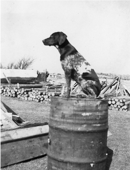
Zita nede ved »Æ Strårntømmer«.

Den var glad for de fleste voksne og børn, men der var enkelte den ville bide.