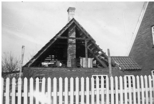
Bedstefars hus efter sneorkanen 1953.

presset entredøren op nede hos bedstefar, og havde fyldt hele gangen og det meste af spise-stuen med sne. Det opdagede nabokonen, som var meget missionsk, og da hun gik derind i stuen, lå der en snedrive op over spisebordet. Der stak lige halsen af et par ølflasker op af sneen.