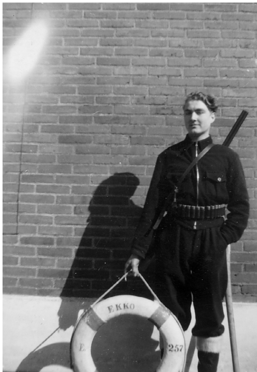
Her står jeg med redningskransen fra Esbjergkutteren »EKKO« der forliste med mand og mus. Kransen var det eneste der blev fundet af kutteren.

Mange af vi unge mænd i Lyngby havde et job hos redningsvæsenet, når der skulle sættes dobbelt vagt ud. Redningsstationen var da kun