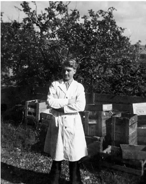
Maj 1950. Jeg har klippet fødderne af billedet, da skoene var for store og stak ud til siden som et par ski. Det var et par golfsko, som en danskamerikaner havde foræret mig.