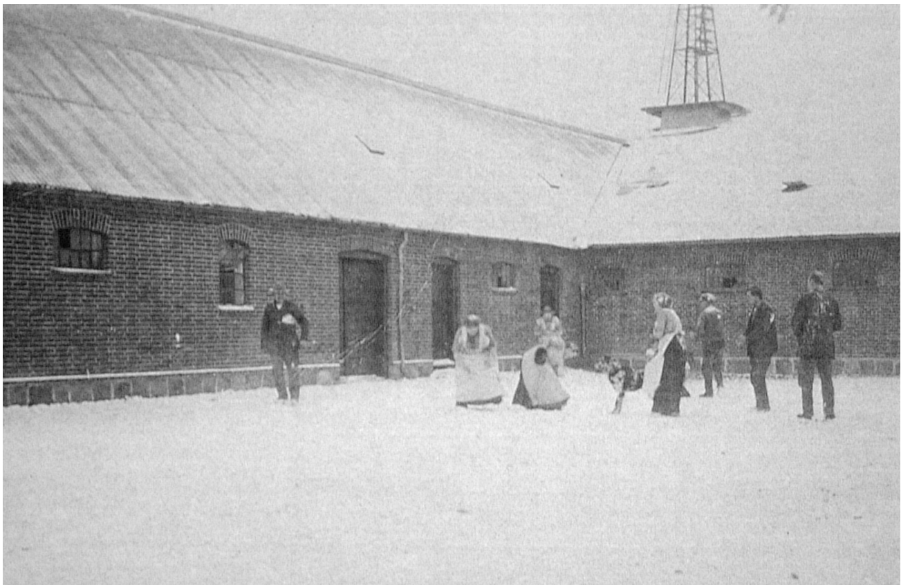
Gårdspladsen på Gadegaard en vinterdag.

Det var også meningen, at møllen skulle kunne trække tærskværket, men dette blev aldrig nogen succes, idet det skulle blæse temmelig kraftigt, for at møllen skulle kunne levere trækraft nok. I så stærk blæst som krævedes, blev det for risikabelt, og tærskarbejdet på gården blev derfor udført af et af de omrejsende