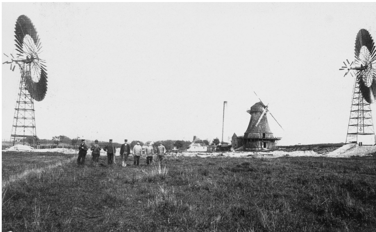
2 vindroser fra Hurup Jærnstøberi opstillet ved Lammefjord.