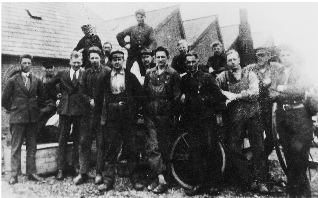
Arbejdere på Hurup Jernstøberi og Maskinfabrik.