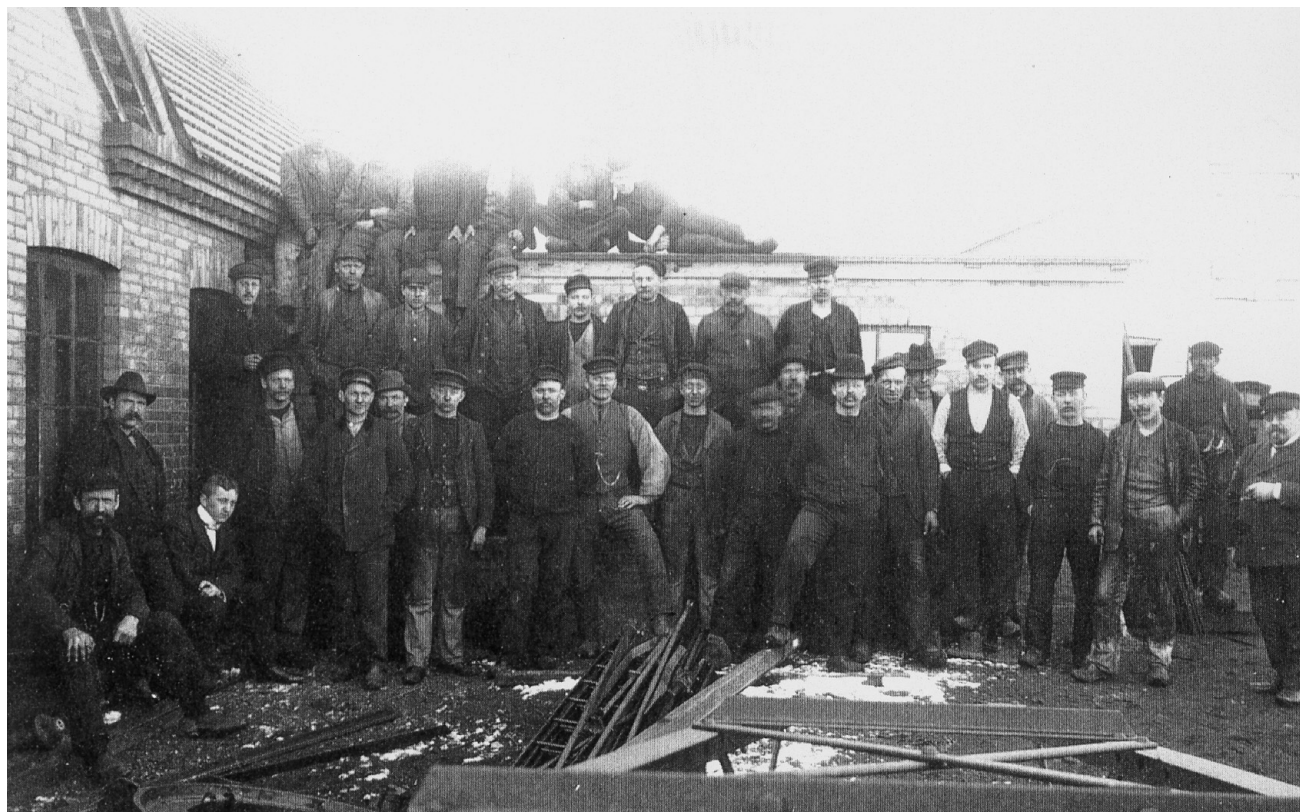
Hurup Jernstøberi (tilflyttet fra Ginnerup 1898). Foran dele af vindmotor prøvesamlet.