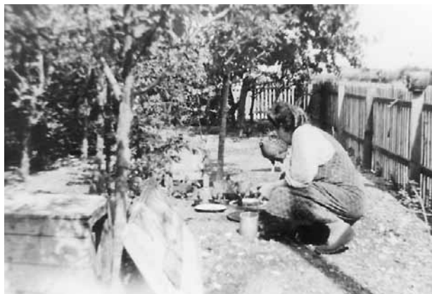
Min mor i hønsegården.

En aften meget sent var mor gået til ro. Hun var alene hjemme, da far var på strandvagt. Det var meget mørkt og stormende, og mor syntes at kunne høre en eller anden gå i gruset uden for huset. Døren fra soveværelset ud til køkkenet stod åben, så mor kunne se døren ud til bryggerset. Hun mente at kunne høre , at der kom en ind i bryggerset, men da der ingen kom ind, så slog hun sig til tåls med, at det var stormen, der havde forårsaget lydene. Da hun lidt efter kom til at se hen på døren ud til bryggerset »reest det æ hoer po mi ho« (rejste det hårene på mit hoved) fortalte mor senere, for håndtaget bevægede sig langsomt og lydløst nedad, og da det var i bund begyndte døren at åbne sig meget langsomt. Endelig stak den unge omtalte fisker forsigtigt hovedet ind og så sig spejdende omkring. Han kunne ikke se mor, da der ikke var tændt lys i soveværelset, og der kun brændte et lille lys i køkkenet. Da der således tilsyneladende var fri bane, smuttede han på strømpesokker op ad loftstrappen.