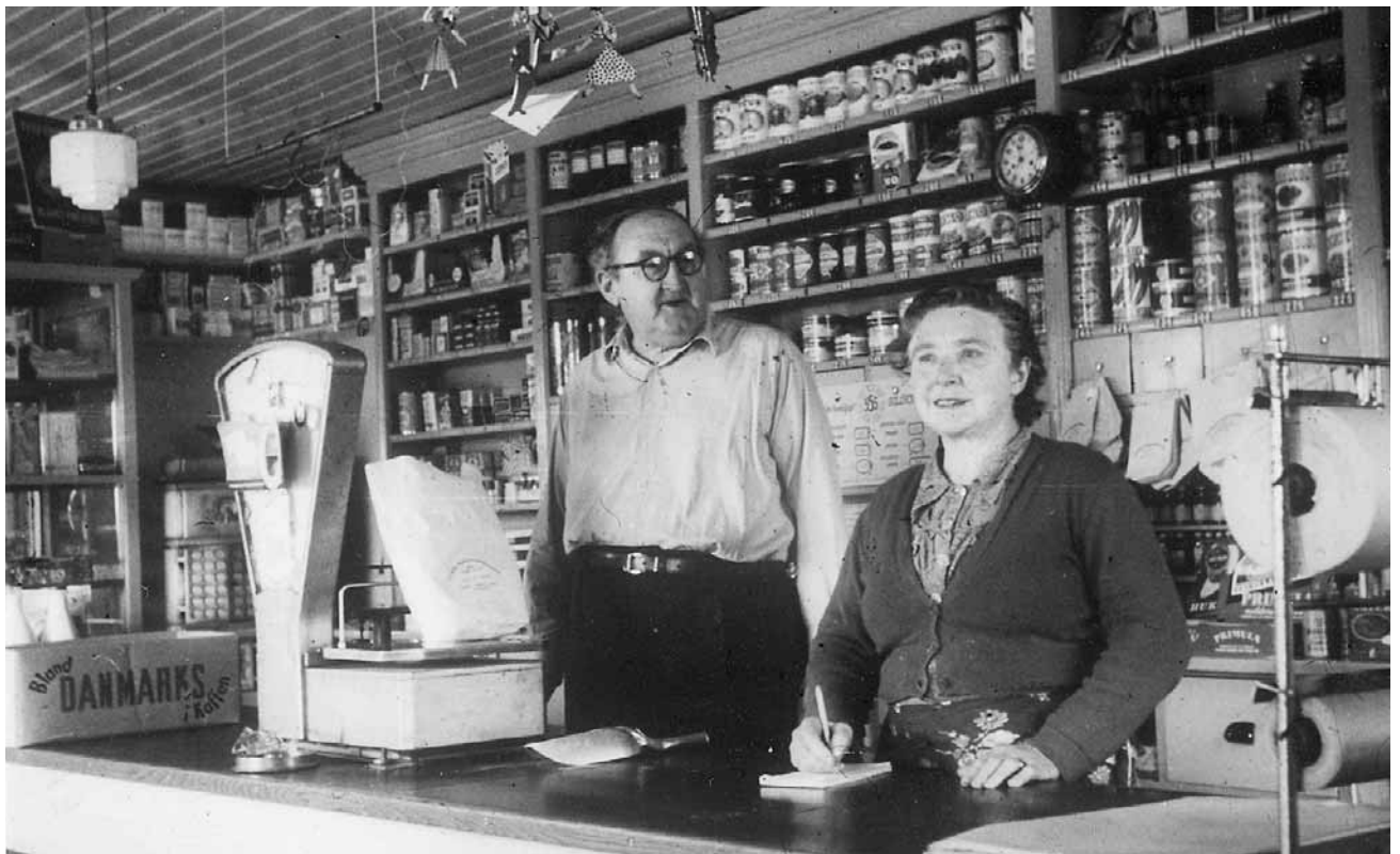
Far og mor i butikken.

og det skal nok stemme. Det var kun hvis jeg havde lavet skarnsstreger bevidst, at jeg blev revset. Hvis jeg uagtsom var kommet til at lave ulykker, skete der ingenting ved det, uanset hvor slemt det var.