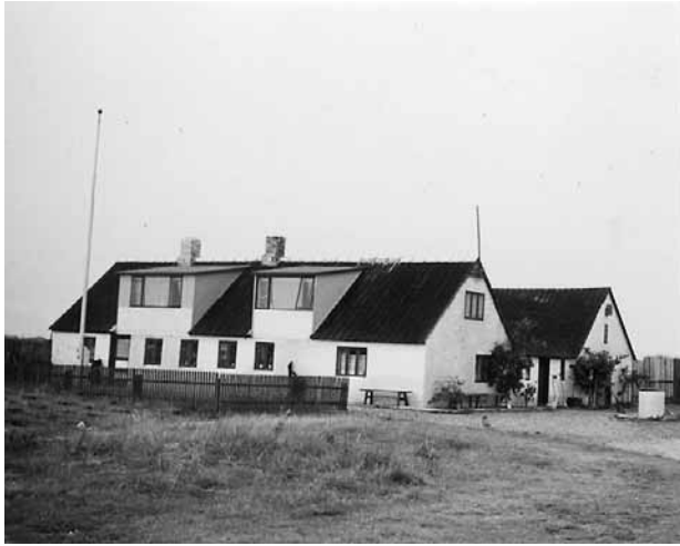
Min mors barndomshjem.

deres hus, da der pludselig blev smidt en sæk over hendes hovede af en der var kommet bagfra. Hun blev puttet helt ned i sækken og og manden tog hende på ryggen og løb med hende. Efter et stykke tid blev sækken åbnet, og da det var hendes fars smilende hovede, der viste sig over sækken åbning, er det meget forståeligt, at barnet blev »så glå, så glå«.