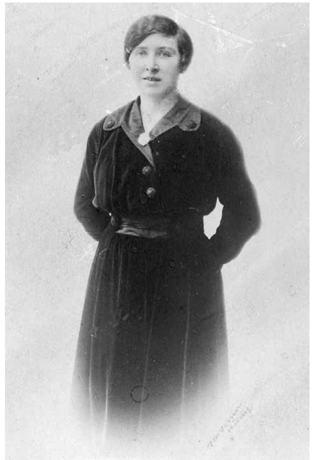
Min mor som attenårig.