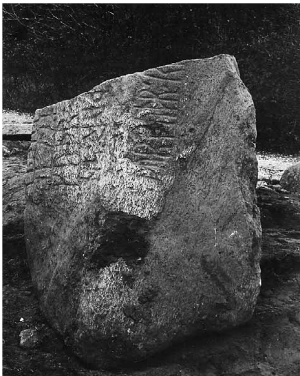
Runestenen i Hurup

Dette stykke er aldrig blevet fundet - og kan