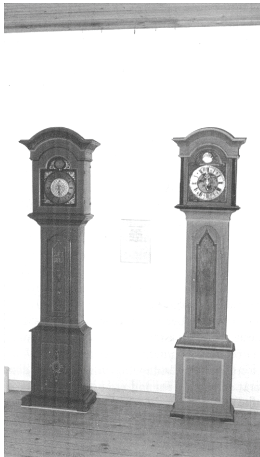
Ure fremstillet af Peder Jensen, Bedsted.

Møblet blev fundet hos en antikvitethandler i København i 1970'erne, og møblets historie kendes ikke nærmere.