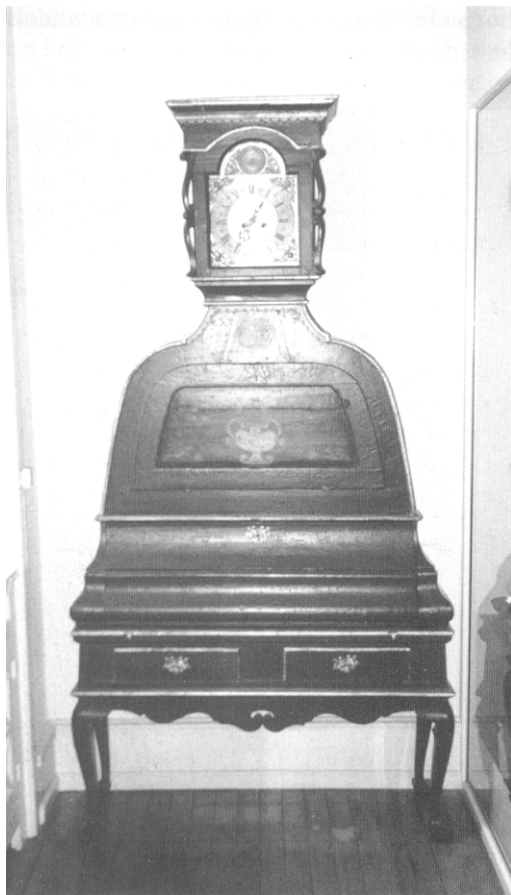
Urnøblet fra Bedsted.