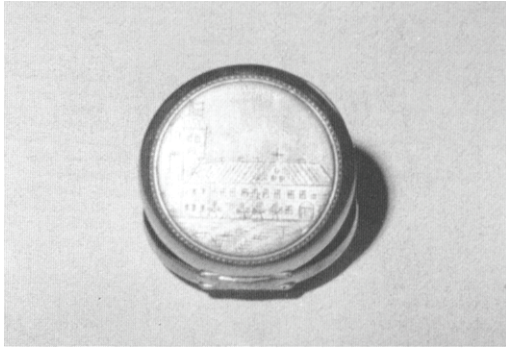
Lommeur med Vestervig Kloster indgraveret.