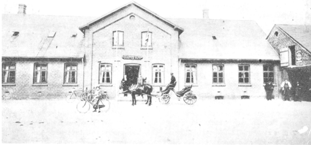
Hurup Kro (senere Missionshotellet) ca. 1900

Vor anden købmand han sad i Ydby, og suged labben så den blev ren, han tog billetten omkring i Sydthy, men det var ej på bare ben.