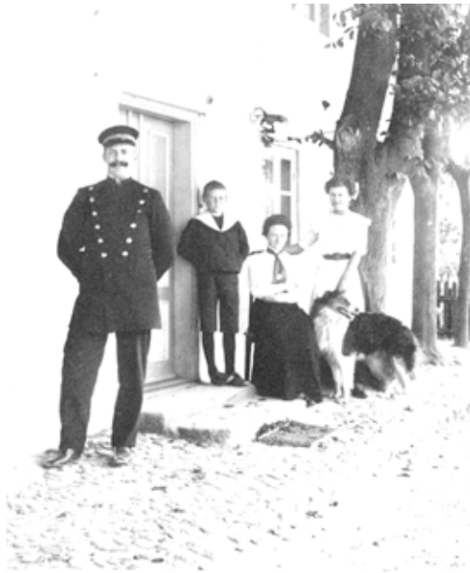
Arrestforvareren og familien i Vestervig, august 1913