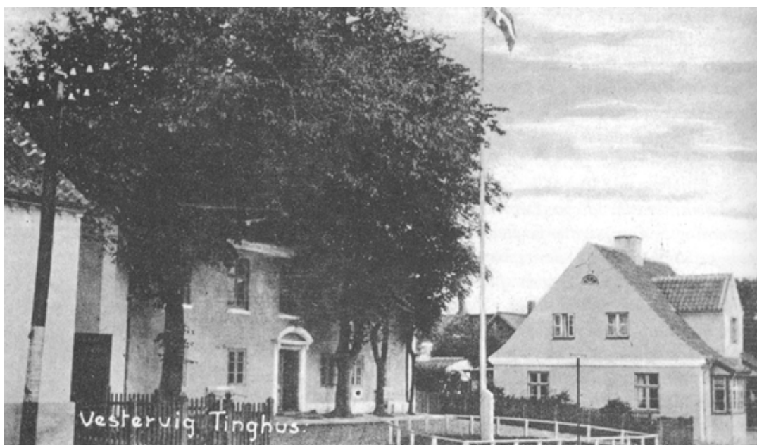
Tinghuset i Vestervig