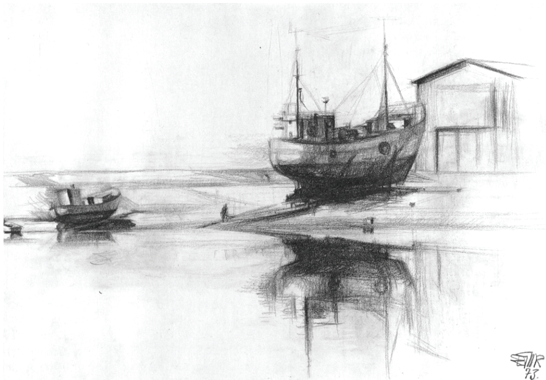
»På bedding« - Agger havn 1973

udarbejdet, men den grå spadseredragt, hun havde fået af sin far, og den ny sorte hat er genkendelige.