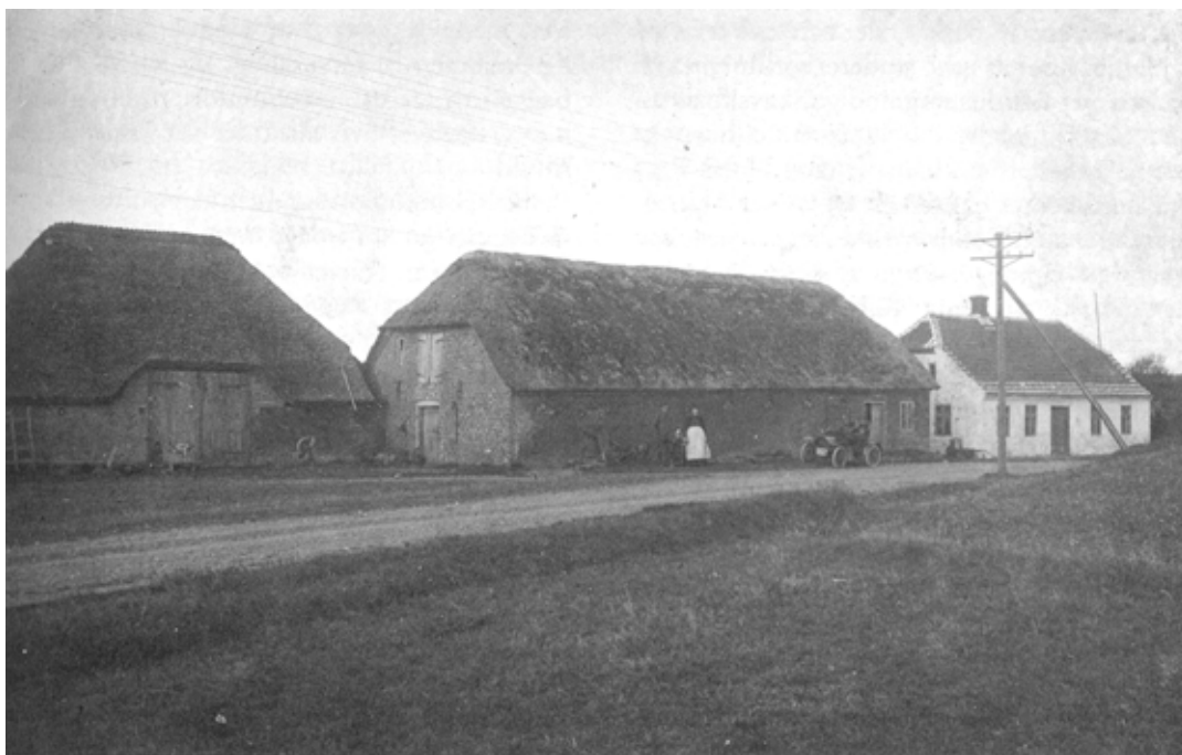
Vejlegård, Sindrup Vejle ca. år 1910

på en god dag kunne der fanges et anseligt kvantum, men kun de færreste endte på stegepanden, idet katten var den eneste, der satte egentlig pris på delikatessen.