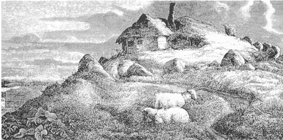
Hedebondens hus er bygget delvis ind i en oldtidshøj. Træsnit i Illustreret Tidende 27/5-1860