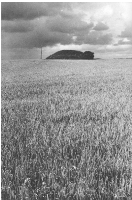
Mørkt stiger en høj over kornhavet op

af Uffe Larsen, Skolegade 13, 7755 Bedsted Thy