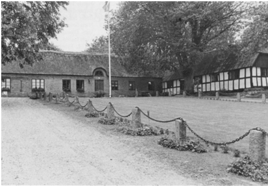
Det ca. 200 år gamle stuehus på »Skibstedgaard« - foto: Chr. Christoffersen. Vi beklager den manglende oplysning om foto i Årbogen 1985 fra »Tandrup«. Disse dejlige fotos var også leveret af Chr. Christoffersen.