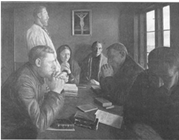
I det religiøse fællesskab og i bonnen hentes kraft og styrke. Niels Bjerre: »Guds barns», Harboore 1897.

tendenser i tiden var med til at forme mennesket og samfundslederen JKP? Hvori bestod afhængighedsforholdet mellem ham og de øvrige hellige? Hvilken ideologisk betydning har JKP og de mange andre lokale samfundsledere haft for samtid og eftertid? Var det hellige fællesskab i virkeligheden rationelt begrundet - som en måde at overleve på, materielt og åndeligt? I hvor høj grad hang JKPs politiske succes sammen med hans position i de helliges samfund?