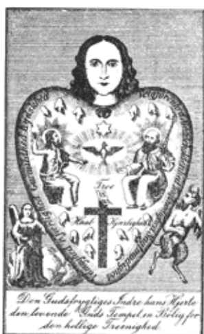
«Vækkelsesens rodder rækker bl. a. tilbage til de pietistiske strømninger i 16.-17.-tallets Europa. Ovenstående illustrationer på admærket vis den gammelpietistiske opfattelse af det fortabte og det frelste menneske. Illustrationerne er hentet fra en lille bog med den store titel: Menneskets Hjertes Spiel, fremstillet i 11 Figurer over den indvortes Tilstand og Beskaffenhed, enten det er et Guds Tempel eller et Satans Værksted. (Odense 1916). - Billederne er udgivet første gang i Frankrig i 1752.

givet emne synes at skjule virkelighedens mange facetter. M. h. t. vækkelsesforskningen specielt gælder det, at de tidlige vækkelsesbevægelser, IM og grundtvigianismen studeres ud fra de religiøse, sociale, kulturelle, politiske, økonomiske, geografiske og ideologiske sammenhænge, i hvilke disse bevægelser optræder - og ikke udelukkende i en religions- eller kirke-historisk referenceramme.