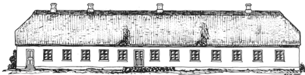
Boddum Præstegård Facade mod have, da bygningen havde stråtag (før 1962)

Følgende handler om præstegårdens indretning og om hvilke dramatiske følger et præsteskitte kunne få i 1690.