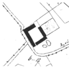
Matrikelkort september 1867