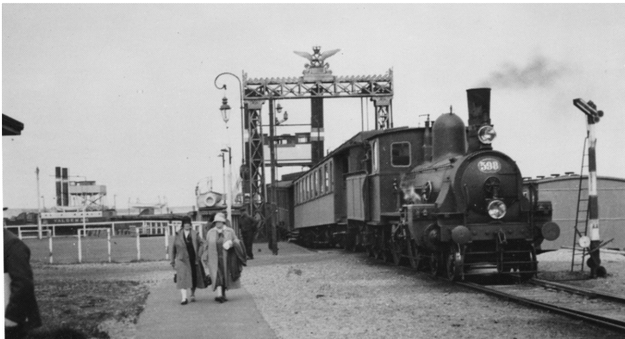
Snart er færgen slut, og så kommer broen. Færgen ses til venstre i billedet med to skorstene og et styrhus.

Jeg tror, tiden nu er inde til at få denne forbindelse med omverdenen, som Thy har haft i sin tid, men som Vesterhavet afbrød og som Staten har gjort sit til at holde afbrudt. Dette bør vi i den kampagne, der rejses, også henvises til.