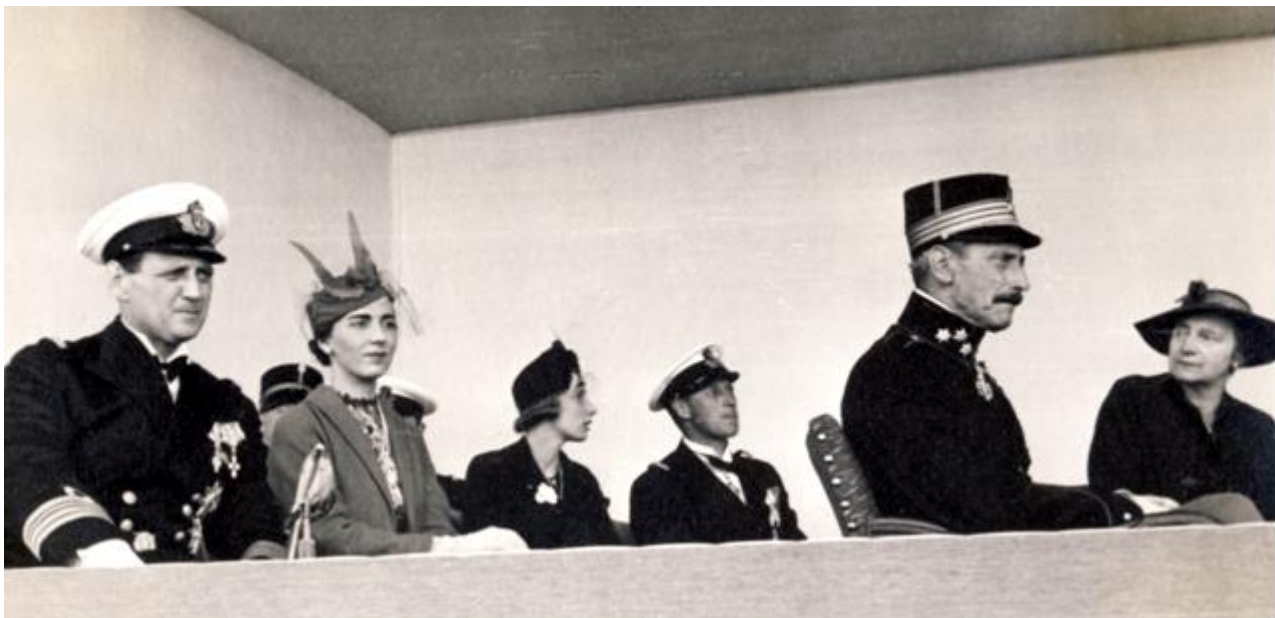
Oddesundbroens indvielse 15.05.1938. På billedet ses kong Chr. X.