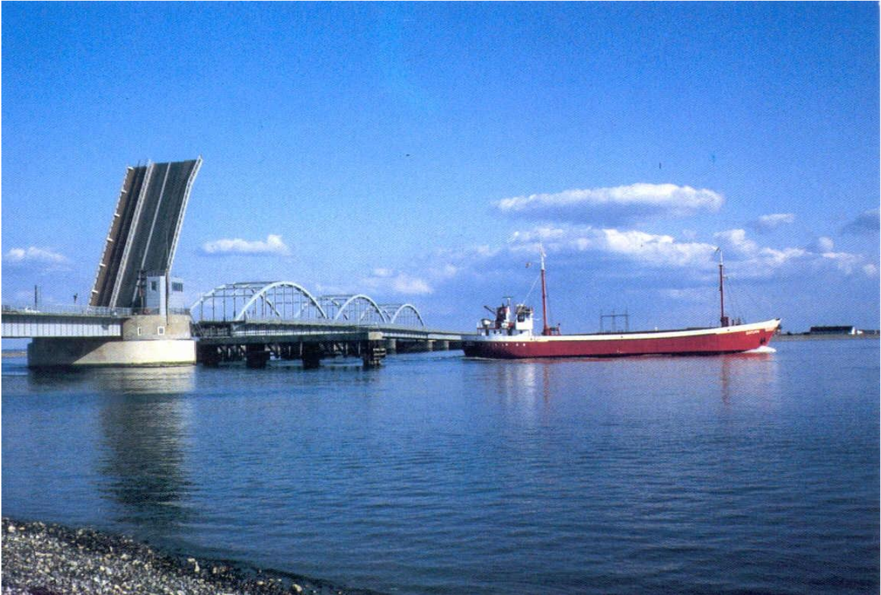
Oddesundbroen, ca. 2000.

Siden er der ikke foretaget videre. I 1926 udtalte trafikministeren i Rigsdagen på foranledning af Kr. Kristensen, at ønsket om en undersøgelse ikke kunne imødekommes.