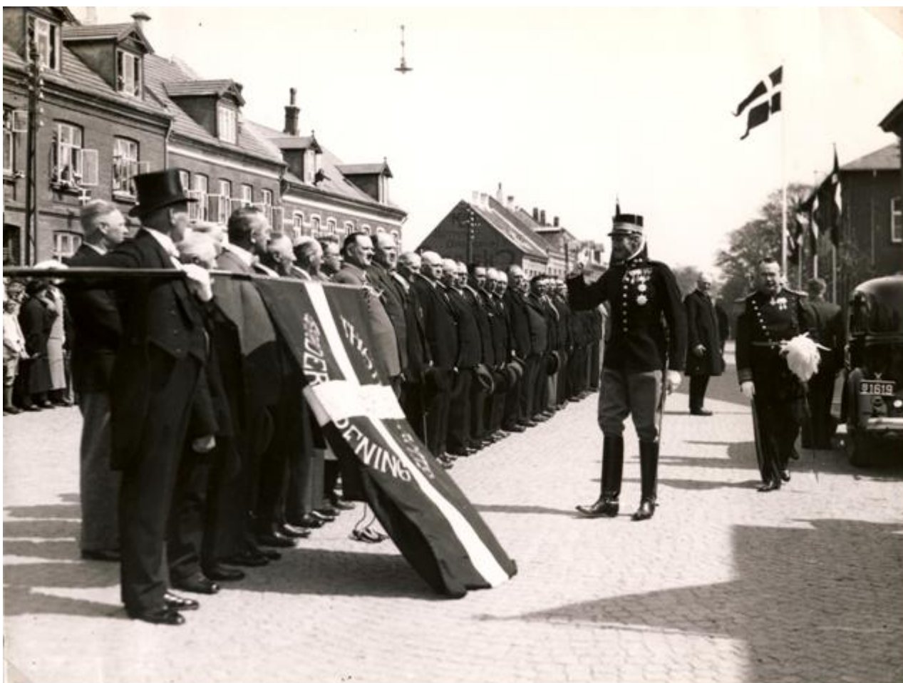
Christian X ved Oddesundbroens indvielse 15.05.1938. Billedet er taget i Thisted - med Thisted station til højre i billedet.

Der er ved Oddesund ca. 1 km. over, men færgen sejler 2,5 km. Ved takstberegning tages der ved overfarten for 10 km. Det er en ekstra udgift, som er lagt på den egn, som skal benytte færgen. På en 3. klasse billet betyder det et tillæg på 40 øre hvilket vil sige, at de knap 100.000 rejsende derigennem betaler 39.000 kr. mere om året. For godset bliver beløbet i hvert fald 3 gange så stort. Så vi kommer op på et meget højt tal, som der betales for, hvad der skal færges over Oddesund.