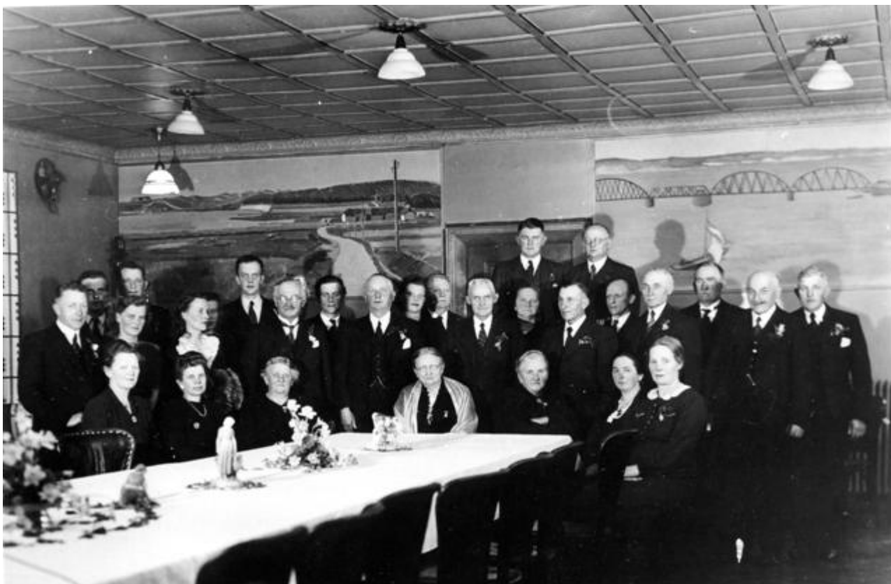
Thisted Amtsråd, 1931.

Amtsrådets vejudvalg, som jeg har drøftet sagen med, har været så ganske enige om, at det havde den største interesse at få undersøgt, hvordan broen kan bygges, så man ikke taler ud i det blå.