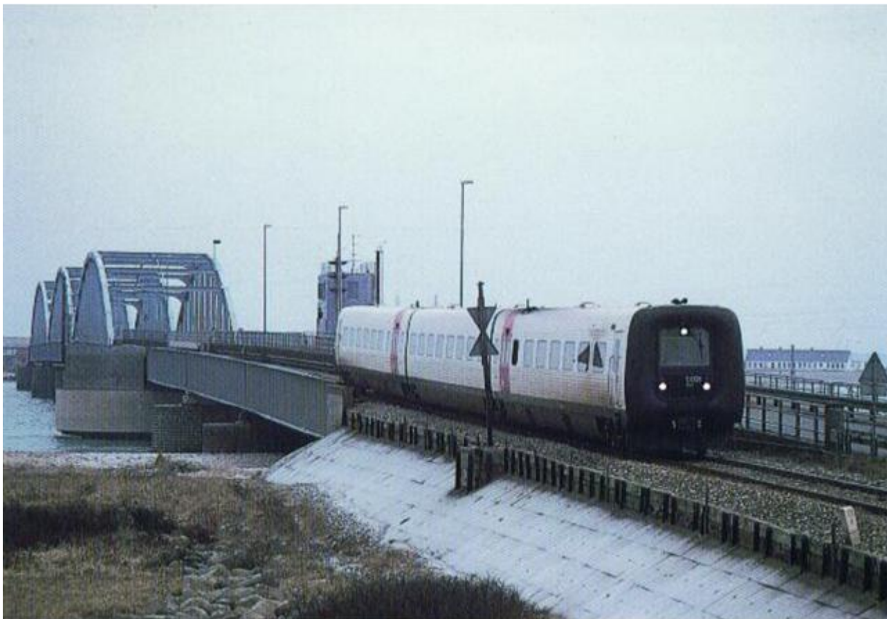
Oddesund Bro med IC3 tog.

blive foretaget en undersøgelse af forholdene ved Oddesund, til udarbejdelse af planer, betænkning og overslag over anlæg af en jernbane- og færdselsbro over Oddesund. Broens bygning vil så endelig blive gennemført ved en særlig lov, således at udgifterne afholdes af Statsbanerne, statskassen og de to amter.