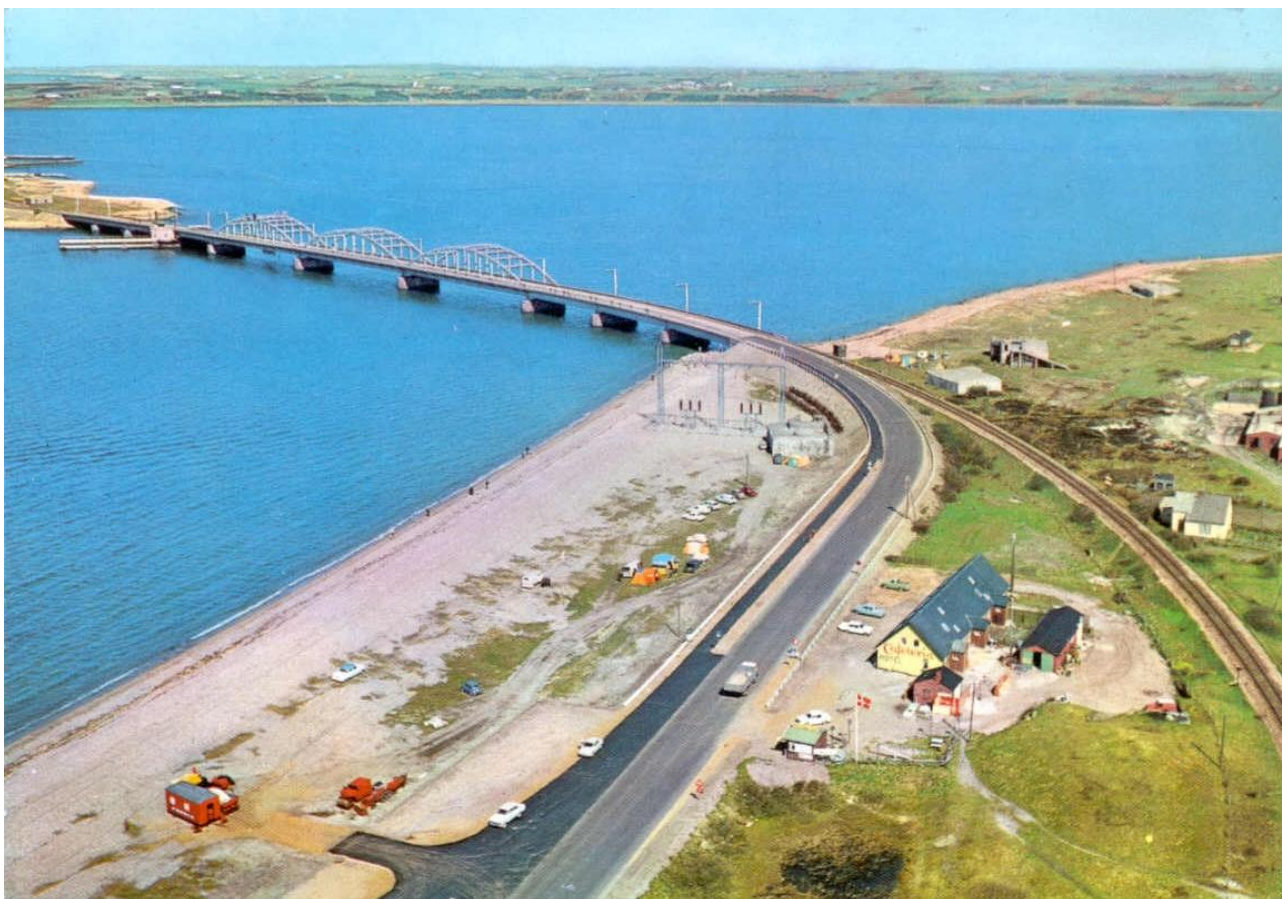
Oddesundbroen, ca. 1968.