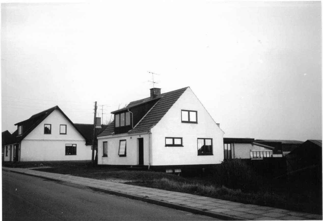
Huset paa matr. nr. 35a i 1984.