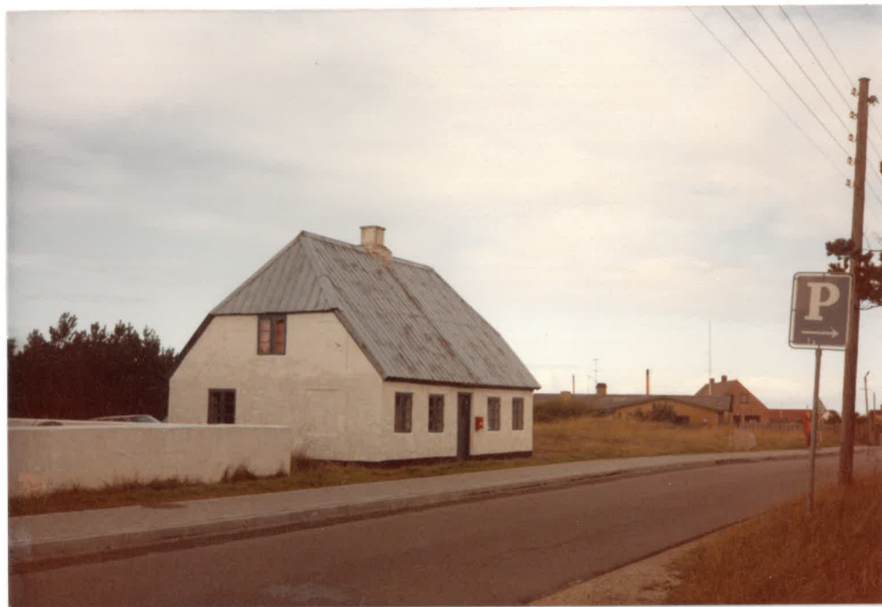
Huset paa matr. nr. 34c i 1980.