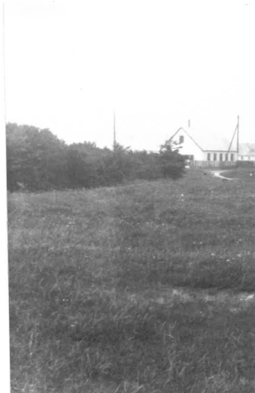
Huset på matr. nr. 34b o.1920. Set fra syd.