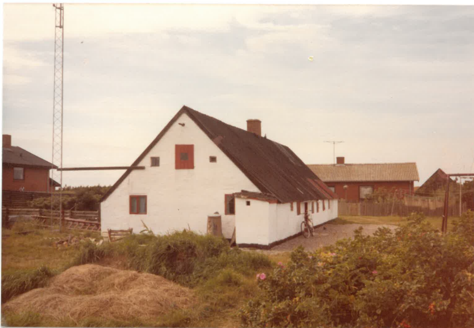
Huset paa matr. nr. 29e i 1980.

Ifølge kirkeregnskab for V. Vandet kirke i 1705 var kirken ejer af ejendommen og fæsteren var: