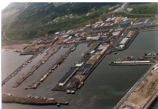
Hanstholm Havn i 1980'erne.