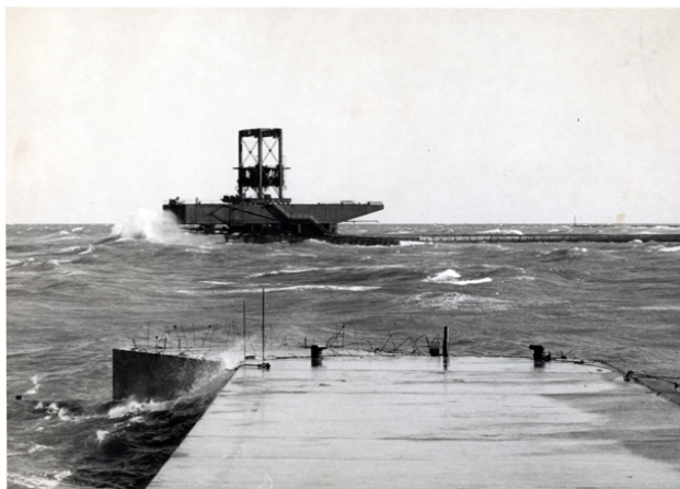
Hanstholm Havn under anlæggelse i 1960'erne. Verdens største selvkørende kran er trådt i karakter.