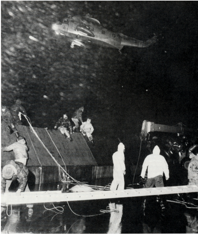
Fra redningsaktionen i havnen natten til 11. januar 1975. "Brda" ligger som vrage uden for tværmolen, og redningsmandskab er på vej over til den.