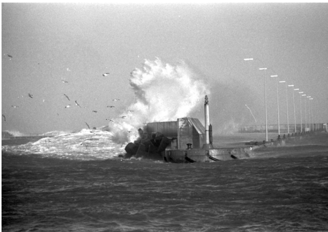
Voldsomme bølger skyller ind over østre tværmole, hvor vrage af den polske trawler "Brda" ligger.