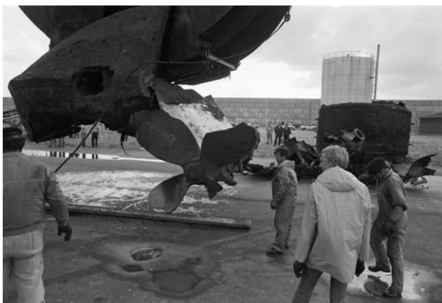
10 dage efter forliset: Hele Thy har fulgt med i dramaet omkring "Brda". Mange vil også studere vraget på nærmeste hold

trawler, knækkede ankerkæden, og de måtte opgive at få en bugserline om bord.