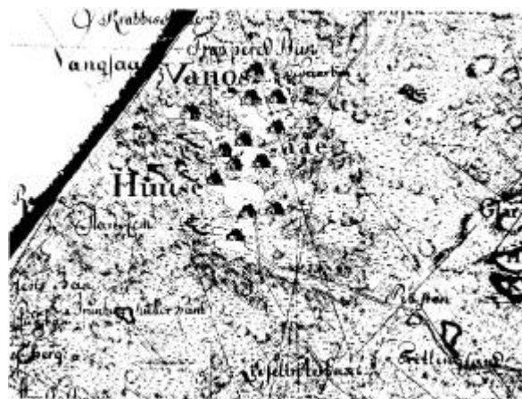
Vangså ca. 1790

Fiskeri havde de vel altid drevet. Markbogen siger, at 2 husmændene samt den gård, kaldes Hove, bruger fiskeri udi havet med kroge, hvorefter de bekommer nogle torsk og kuller undertiden". Hvis tiderne for landbruget blev ringere, ville bønderne have dårligere råd til at holde daglejere, og det er da naturligt, at fiskeriet nu blev husmændenes hovederhverv, og at de så, når deres jord ikke var værd at dyrke mere, flyttede til havet. Der havde de bedre muligheder for at kunne udnytte fiskeriet, de kunne græsse deres kreaturer i klitterne, måske også dyrke lidt jord, og de var ikke længere borte fra gårdene, end at de kunne taget noget arbejde for bønderne, når der var noget. Det var helt op i vort århundrede almindeligt, at fiskerne gik på høstarbejde inde i landet. Deres vilkår var efter flytningen ikke væsentlig anderledes end før, snarere var der udsigt til forbedring, når de havde tilpasset sig til forholdene derude. Et vidnesbyrd om en sådan forbedring er det, at hartkornet, der for disse huse 1688 var 1-5-0-1 og efter flytningen blev nedsat 1733 til 0-7-2-1, blev forhøjet 1844, da Vangså hys hartkorn blev ansat til 3-6-2-2½.