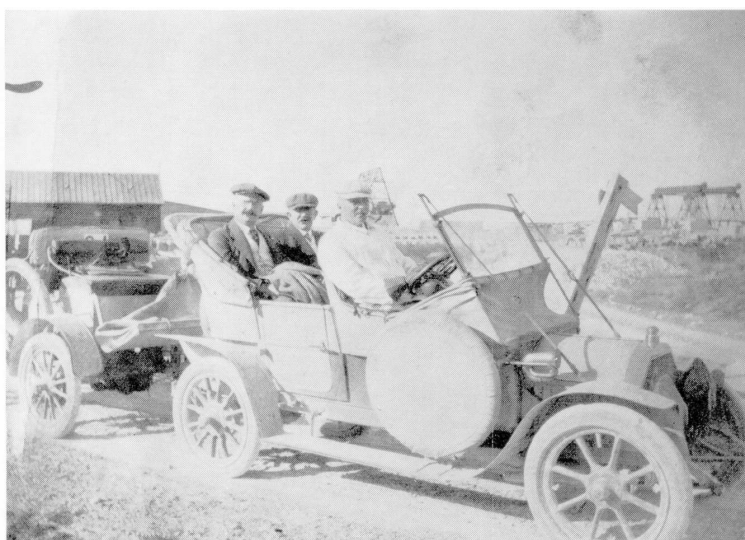
Den gule Opel med min far ved rattet.

Alle fik viklet sig ud af tæpperne og sprang af vognen - antagelig rystende af skræk -, hvorefter far ganske langsomt kørte forbi, og det viste sig så, at den eneste, som ikke var bange, - var hesten, som stod ganske roligt og fandt sig i sin skæbne, - ja man kan jo næsten tænke, at det var stor ståhej for ingenting.