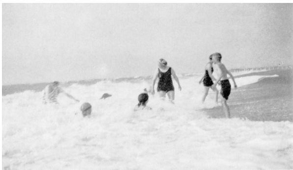
I bølgenes brus. Far med hunden, som ønsker at komme i land.

Da far en tid lå syg med lungebetændelse, måtte der nødvendigvis antages en vikar, og det blev en yngre læge fra København; han var rar, kunne fortælle mange morsomme historier og oplevelser, og de kunne godt virke oplivende i en ret trang tid. Han var ”rask i munden”, og man kan ikke sige, han var særlig tålmodig, - men en gang oplevede jeg, at han fandt sin overmand (eller ”overkvinde” i dette tilfælde). Der var kommet en kone ind på klinikken for at føde. Hendes hjem var lille og ikke særlig rent, og jordemoderen havde måttet love hende forskellige ting - så som hat og frakke - for at få hende til at lade sig indlægge, men så var der jo ikke andet at gøre end vente, til ”hendes time” kom.