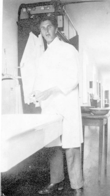
Min bror ved den store håndvask. Klinikken's lange gang.