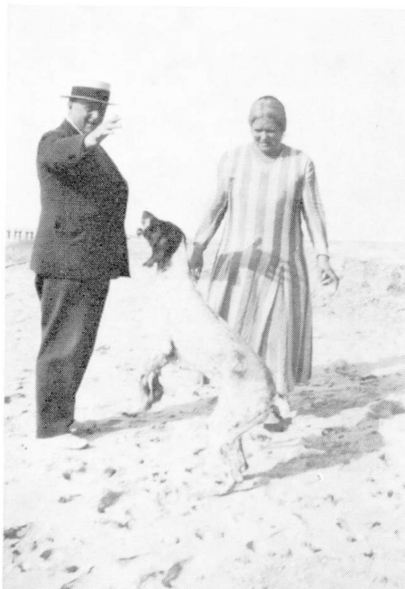
Mine forældre på stranden i Vorupør.

Sygeplejersken samlede sammen på sygebesøgene, - om jeg må sige det således, - og hun ringede efter far. Der var et såkaldt ”doktorflag”, som blev hejst på skolens flagstang, når doktoren skulle komme, og på den måde blev så mange sygebesøg som muligt samlet sammen, - dette flag kunne ses langt væk -, man skulle spare på kørselspengene.