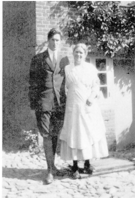
Min mor og min bror.