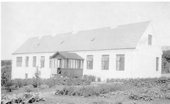
Klinikken set fra syd-øst, inden beplantningen voksede op.