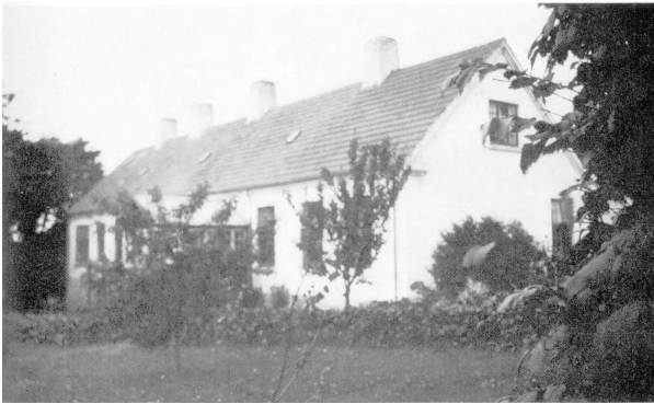
Klinikken, træerne vokset til.