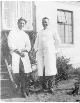
Min far og min bror ved klinikkens veranda.