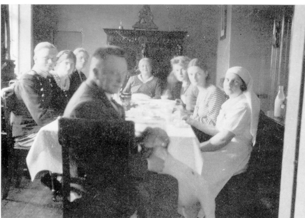
Søndag eftermiddag i lægeboligen.

Jeg blev forfærdet, men tænkte straks: nej, det kan du ikke sige til nogen! - om det var rigtigt eller forkert, ved jeg næppe den dag i dag, - men jeg gemte det dybt ned i en skuffe og ønskede, at det måtte komme til at vare meget længe, inden jeg skulle åbne det.