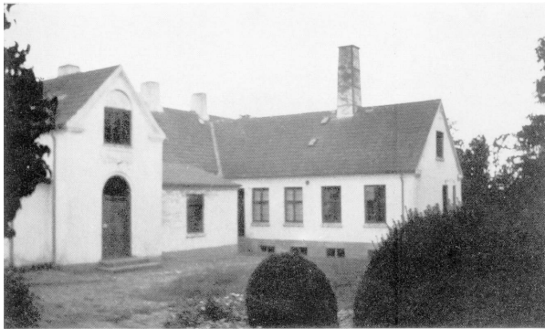
Klinikken i Hunborg set fra nord-øst.