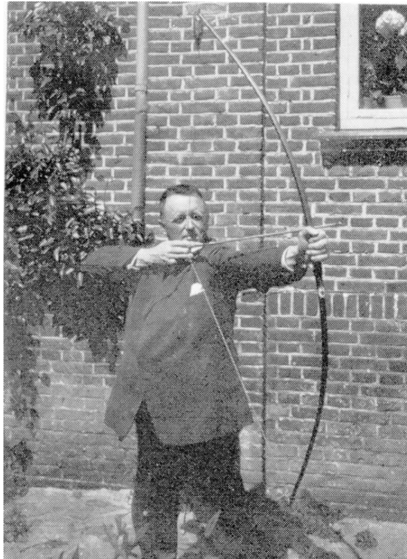
Min far med sin flitsbue.