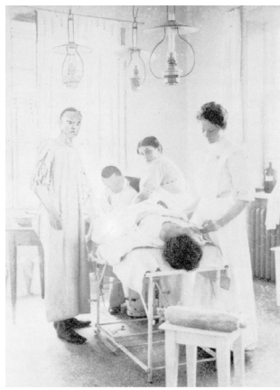
En operation på klinikken ca. 1910. – Et tilskadekommet ben ”repareres”. (Min far for enden af operationsbordet.)