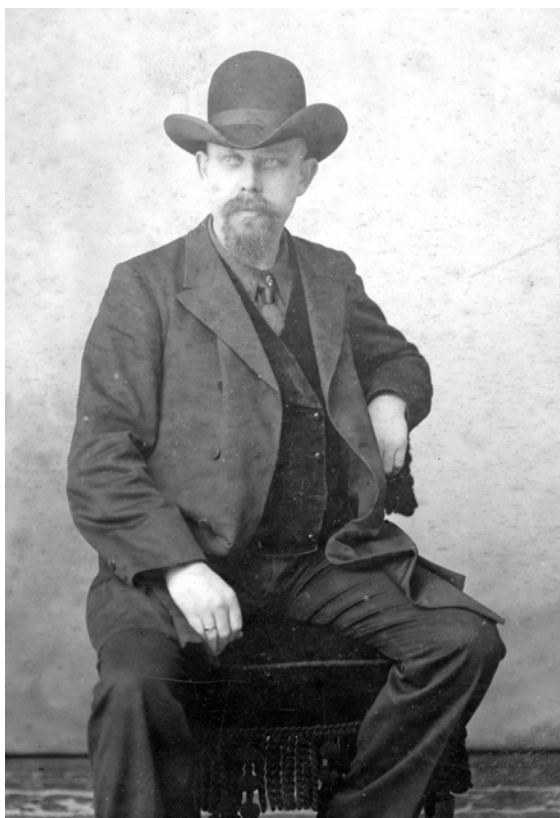
Skjoldborg ligner en cowboy, men det er ikke et billede fra Amerika. Det er taget ved fotografen i Allinge, Bornholm!

»Jeg mangler i min udvikling at se Amerika. Aa, hvor har jeg ikke tit hørt det navn i min barndoms- og ungdomstid – det forjættede land. Amerika har suget alle de dygtige blandt vore proletarer til sig – dem, der ikke ville give op. Jeg vil se, hvad der er bleven af dem – og jeg vil se alt det andet storslåede derovre.