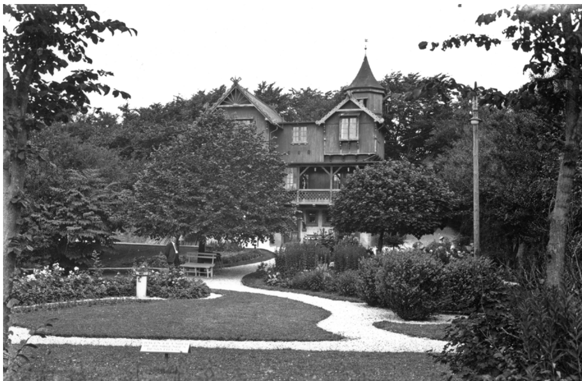
Thykiers Have, 1930.