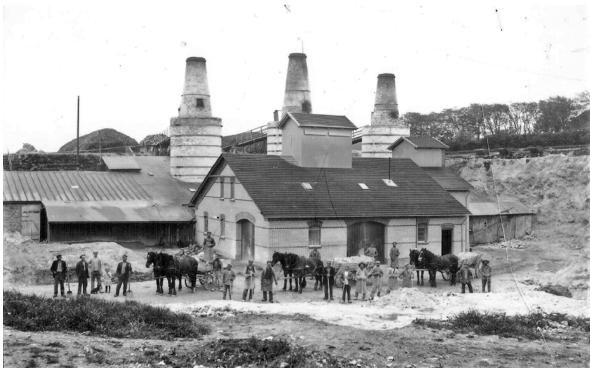
Thisted Kalkværk, 1910.

Den entreprenante Thykier udnyttede sit nedlagte kalkværk ved fjorden til at skabe sig et efterhånden spektakulært fristed for sig selv og sin familie. På grunden byggede han en anselig sommervilla og fik tilladelse til at udvide grunden med opfyld ud i fjorden, så der efterhånden blev skabt en park med et udsigtstårn yderst ude, hvorfra Thykier blandt andet kunne se Frederiksværk dampe sydover på sin rute til Doverodde.