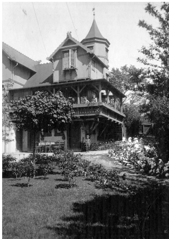
Sommervillaen var et meget karakteristisk træhus med »spiral«.