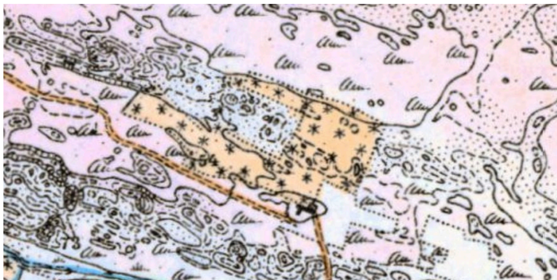
Thagaards Plantage, 1882.

Megen korrespondance handler om problemer i forbindelse med løn, diæter og gratialer. Lauritz