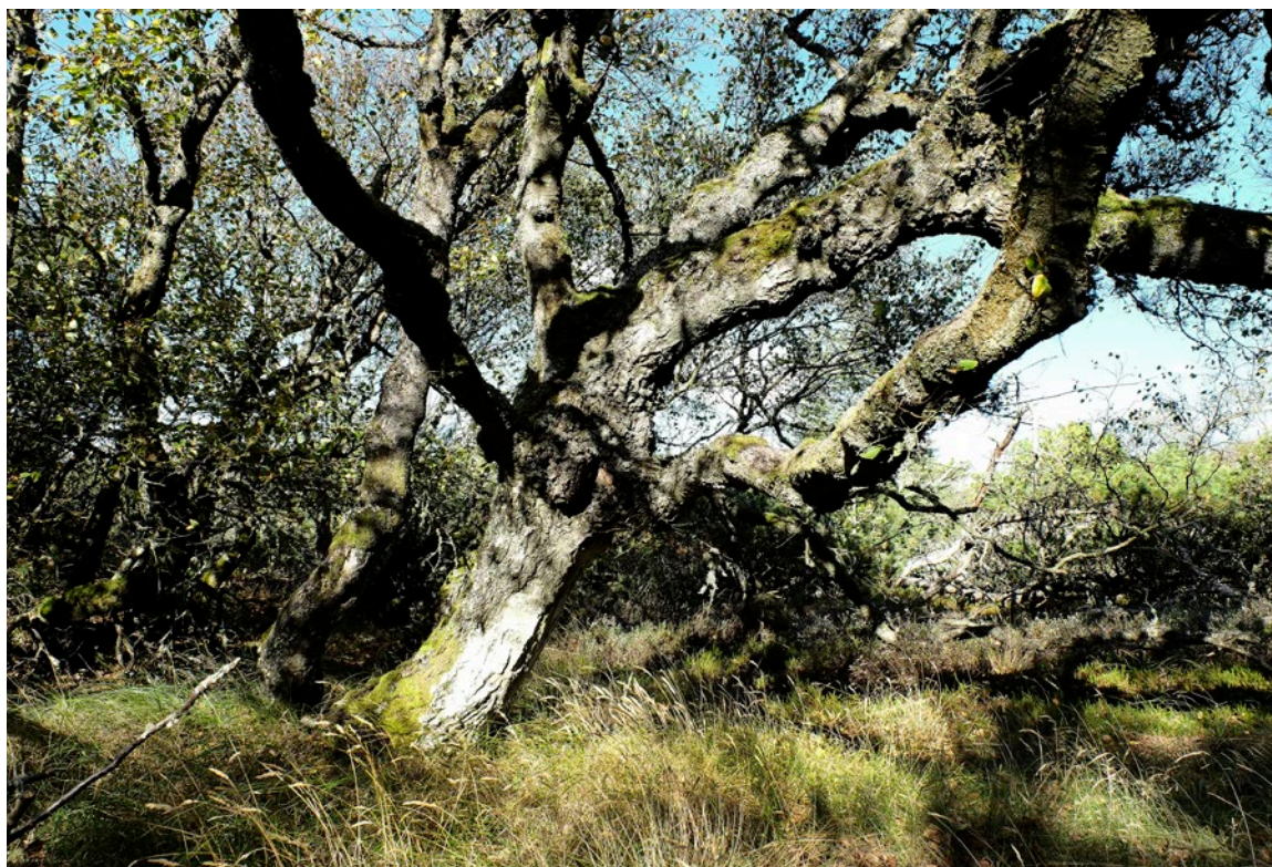
Thagaards Plantage.

om det ej kunne blive mig tilladt at befordre mig paa mine reiser i Klitten selv, imod at naar enhver af de kjørepligtige Beboere, for hver Kjørsel de skulle afgive, betale mig 2Rbmk. i Tegn; - Da jeg i dette Tilfælde kunne opdage mange Uordener med Slet og Kreaturer, som mig naar jeg kjører, vil blive umueligt at faae fat paa. - Deres Velbaarenhed behagede at svare, at De aldeles intet har derimod, naar Beboerne, som bliver tilsagt at afgive Befordring, godvillig vilde betale de forestaaende 2 Rbmk. Tegn. - I Fjor Foraar har jeg adskillige Gange til Fods gaaet til Skovplantagen i Thorups Klit, for at spare Bønderne i den travle Sædetid for Kjørsel. - I min Circular Skrivelse af 16de næstforhen har jeg rigtignok anført, at naar enhver, som bliver tilsagt at afgive Befordring, møder, at de i saa Fald ingen Godtgjørelse fik for deres Kjørsel, men desforuden bliver nødsaget til at betale. - Aldrig har dette været min Mening. - Jeg kan lovlige bevise, om det forlanges, at