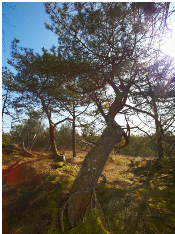
Thagaards Plantage.

I Charlotte Boje H. Andersens beretning om Tvorup Skovhus er nævnt ulovlig kørsel med vogne gennem plantagen og omstrejvende får.