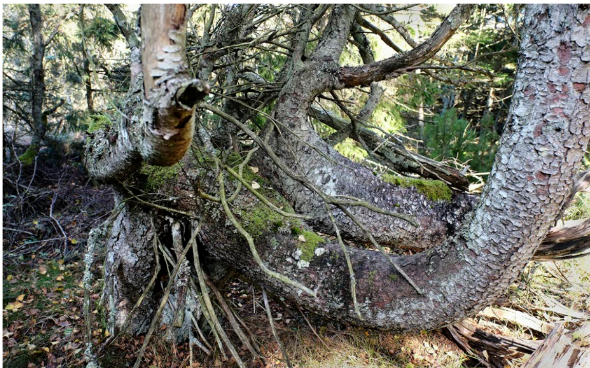
Thagaards Plantage.

plantningen blev foretaget står hen i det uvisse. Der nævnes plantning i huller efter mislykket såning og plantning i fuldbearbejdet areal. Noget tyder på, at der også kan have været plantet i pløjede striber.