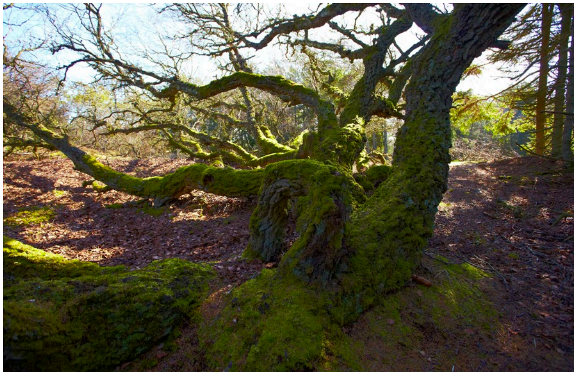
Thagaards Plantage.