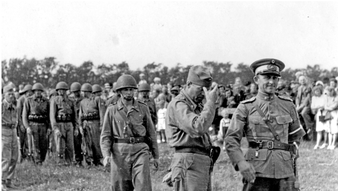
Afmønstring af tropperne 1945.

en indsats i frihedskampen, og som loyalt og tillidsfuldt gav sig ind under mit selvbestaldede førerskab.«