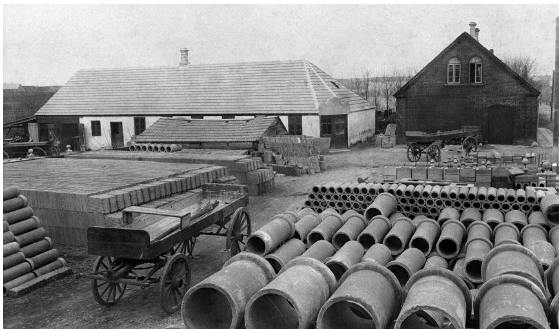
Notlevsens Cementvarefabrik i Hurup, u.å.