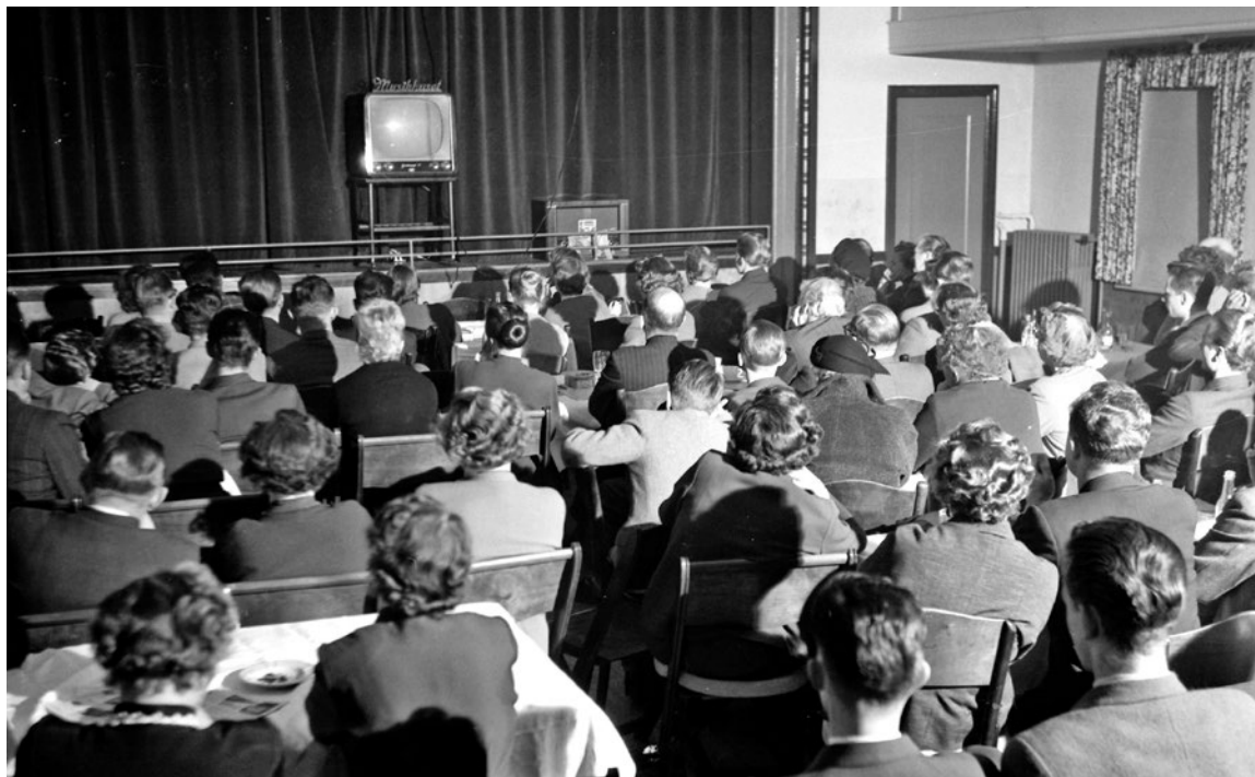
Hotel Aalborg 1955. Thisted's største fjernsynsstue. Det krævede gode øjne at følge med på skærmen i det fjerne. Men en begivenhed er det under alle omstændigheder.

Man begyndte allerede at se frem til OL i Rom, og da der i sommeren 1960 blev blændet op for begivenhederne i den evige stad – med den ligeså evige Gunnar NU bag mikrofonen – var antallet af fjernseere i Hanstholm steget betragteligt.