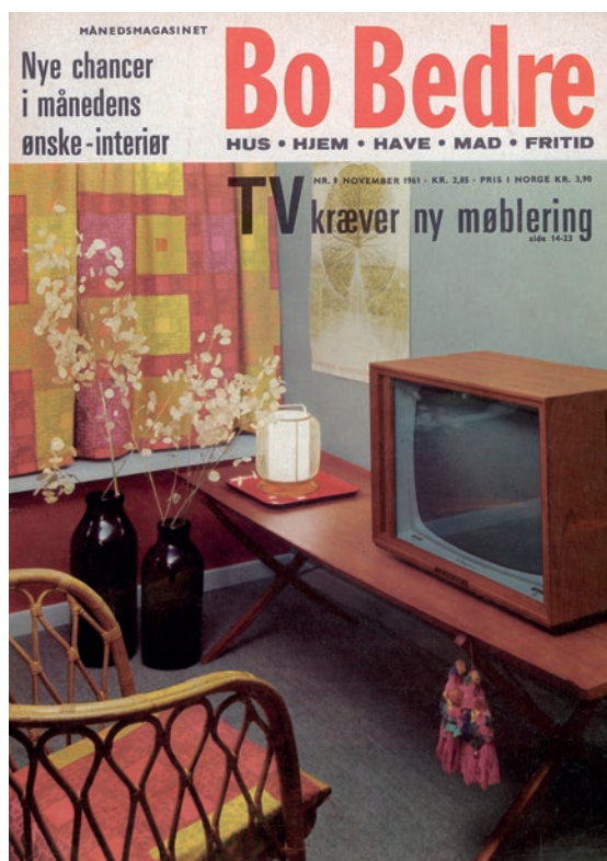
1961. Nu i farver! I hvert fald i magasinet Bo Bedre. Der skal møbleres om, når et fjernsyn rykker ind i stuen.