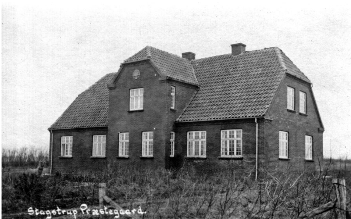
Stagstrup præstegård, opført 1920.