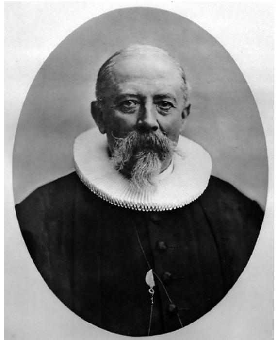
Vilhelm Beck, Indre Missions grundlægger og leder 1861-1901.

De såkaldt »gudelige vækkelser« havde deres udspring i starten af 1800-tallet, men fik for alvor vind i sejlene, da de blev lovliggjorte med indførelsen af den første frie forfatning og dermed religionsfrihed i 1849. Vækkelserne rummede både en kollektiv og en individuel dimension. På den ene side var de en del af de folkelige bevægelser, som, inspireret af internationale strømninger, skyllede hen over landet fra 1830'erne. Bevægelser, som både talte bønder, borgere og lidt senere også arbejdere og kvinder, og som i høj grad var med til at forme det nye demokratiske Danmark og gøre op med enevældens ekstremt topstyrede samfund. På det religiøse område gjaldt opgøret ikke mindst præstevældet. Man opfattede kirkelivet som kedeligt og stillestående og for præget af konservative, reaktionære teologer. Man ønskede