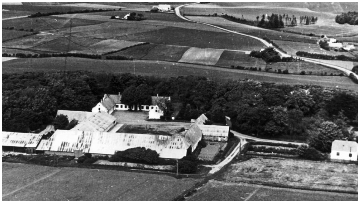
Gården Øland, 1959.