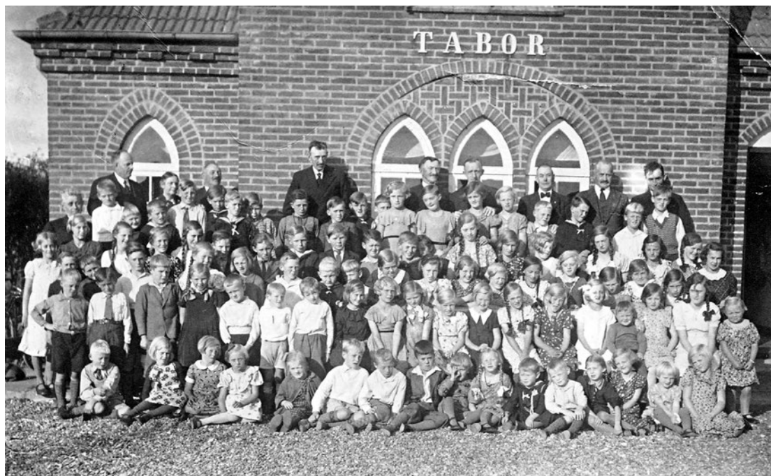
Søndagsskole i Tabor, ca. 1940.

Huset havde anderledes ejerskabsforhold end de fleste missionshuse, der som regel blev bygget for lokale midler, men derefter tilskødet Indre Missions landsorganisation. Tabor forblev derimod selvejende gennem hele sin eksistens – som missionshus. Det blev indviet den 20. maj 1924 og nedlagt på samme dato i 2009. Året efter blev Sundby missionshus solgt og et nyt kirkecenter ved Stagstrup kirke taget i brug som mødested for de to sognes Indre Missions samfund, der samtidig blev slået sammen. Landsorganisationen fik nu endelig ejendomsretten over Tabor , som vedligeholdes med pengene fra salget af »nabohuset« i Sundby. Samtidig fik Museum Thy overdraget »brugsretten« til huset, der om sommeren huser en lille udstilling om Indre Mission.