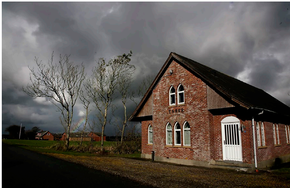
Missionshuset Tabor, 2011.

noget særligt ved det? Allerede på afstand springer de spidsbuede vinduer i øjnene og giver, trods husets ringe størrelse, mindelser om gotiske katedraller. Kommer man lidt tættere på, bemærker man straks navnet på facaden: TABOR. Den udenforstående beskuer vil nok ikke tænke nærmere over det; der er jo så mange navngivne huse rundt omkring. Den bibelkyndige læser vil genkende det som navnet på »Forklarelsens Bjerg« i Galilæa, hvor Jesus ifølge Matthæus-evangeliet