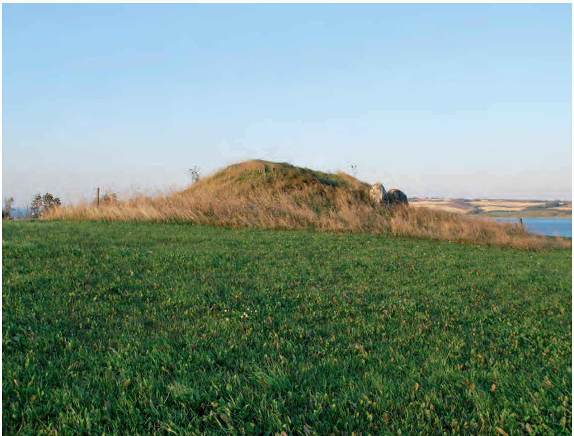
Stendalhøj anno 2013.

Langdysse? I sognebeskrivelsen står der megalitgrav, ældre tragtæggekultur. Det vil sige, at højen kan være mere end 5000 år gammel; men derfor kan den godt have rummet langt yngre begravelser, f.eks. fra bronzealderen. Der er kun kendskab