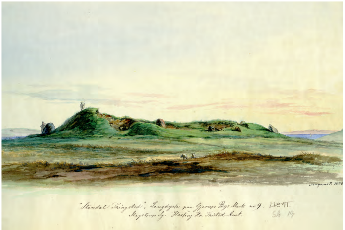
»Stendal Thingsted«, Langdysse paa Gjerup Bys Mark no. 9, Stagstrup Sg. Hassing Hr. Thisted Amt. Akvarel af Magnus P., 1875.

en del af marken fra naturens hånd har overvældende mange flintesten.