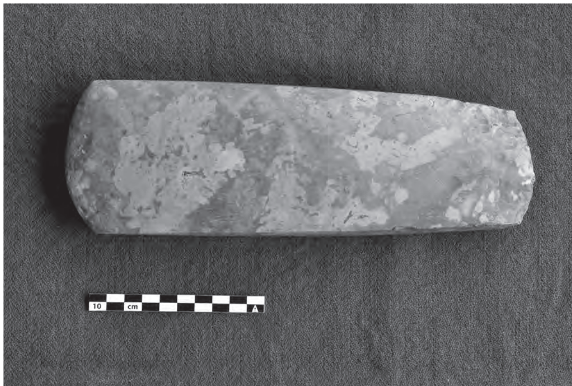
Øksen fra Gærup befinder sig nu på Thisted Museum.

Det andet fund blev også pløjet op. Det skete lidt længere mod nordvest end der, hvor jeg havde gjort