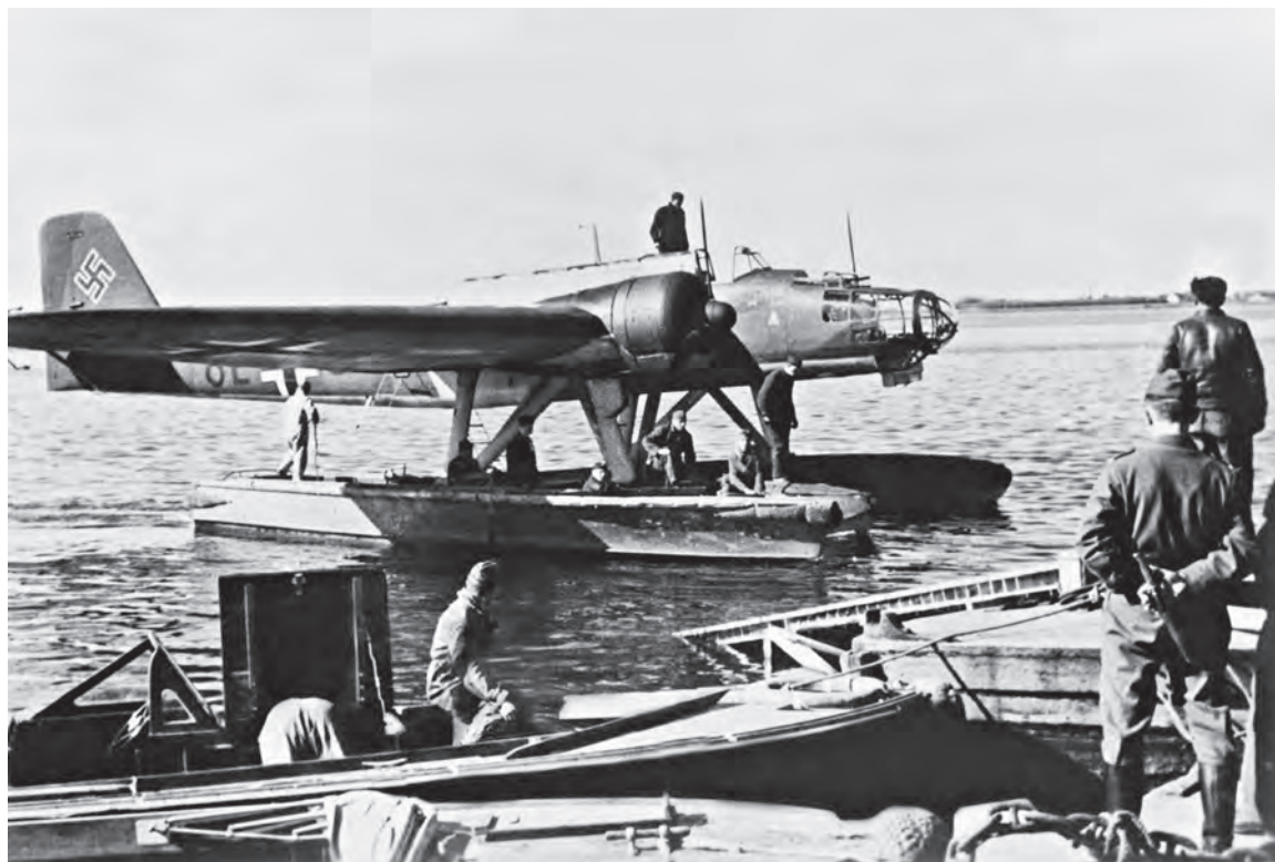
Et tysk søfly af typen Heinkel He 115 fra 1./Küsten-Flieger-Gruppe 906, fotograferet i på Limfjorden ved søflyvepladsen ved Aalborg i april-maj 1940. [identificerer flyets tilhørsforhold til 1/906, og eskadrillen var fra 11. april 1940 stationeret på Aalborg See – baggrunden ligner også i den grad. (Bildarchiv Süddeutscher Verlag).

Midt på eftermiddagen 7. maj 1940 indløb der en alarm fra Hanstholm til Führer der See-Luftstreitkräfte Ost , som sad i Kiel og styrede indsatsen af søflystyrkerne i Østersøområdet – hans ansvarsområde gik helt op til Hanstholm. Alarmen lød på, at man havde observeret en kraftig tåge foran kysten vestnordvest for Hanstholm, og at man mente, at den var kunstig.