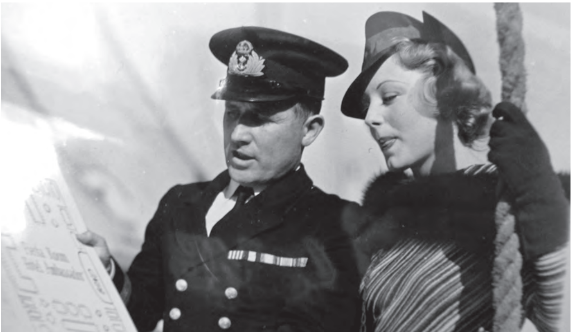
Rutland fotograferet i Californien under Anden Verdenskrig, formentlig med en filmstjerne.

Flyveren, der ingen skade havde taget ved det kolde bad i Vesterhavet, kom i huset hos Herredsfoged Fugl i Vestervig. Han fortæller, at han ved 4-tiden søndag morgen steg op med sin maskine i England og gik ud over Vesterhavet. Stormen blev imidlertid for stærk og drev maskinen længere og længere over mod den jyske vestkyst. Dette tærede så stærkt på benzinbeholdningen, at denne truede