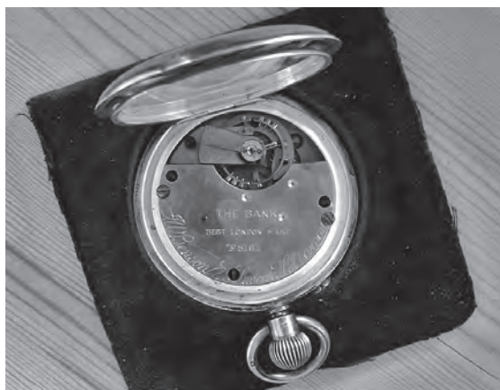
Bagsiden af Vilhelm Villadsens ur.