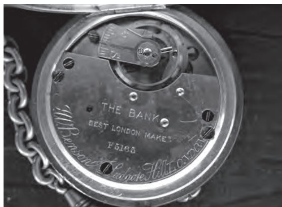
Urene var fremstillet af firmaet J. W. Benson i London.

De fem fiskere og redningsmænd modtog alle et ur som belønning. Et lommeur, på hvis bagside der står indgraveret: »Presented by the Lords Commissioners of the Admiralty to (navnet) for services rendered to a British Naval Airman, wrecked at sea and landed at Akka (Agger,) April 29th 1917.«