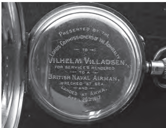
Vilhelm Villadsens ur. Inskription fra Admiralitetet i London.