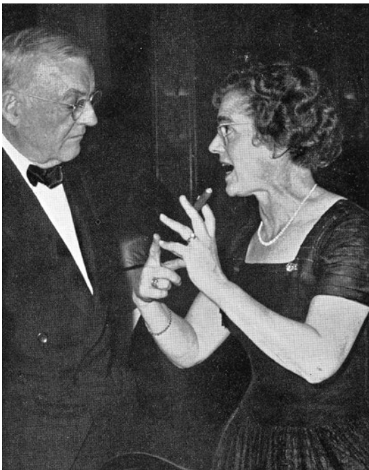
Den amerikanske udenrigsminister John Foster Dulles gjorde store øjne, da han i 1958 mødte den cigarrygende kirkeminister Bodil Koch.

For resten husker jeg, at min moster, der gik til porcelænsmaling, dekorerede et tobaksfad,