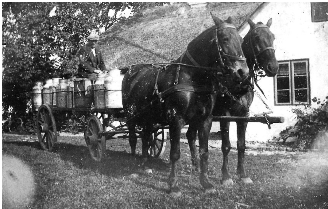
Mælkevogn på vej til Sundby mejeri.

sig. Der var flere metoder, men i mere end 100 år har man kølet ved at stille spandene i vand-beholdere. Allerede omkring 1860 fandt man ud af, at det var nemmere at lave ost og smør, når mælken havde været kølet ned.